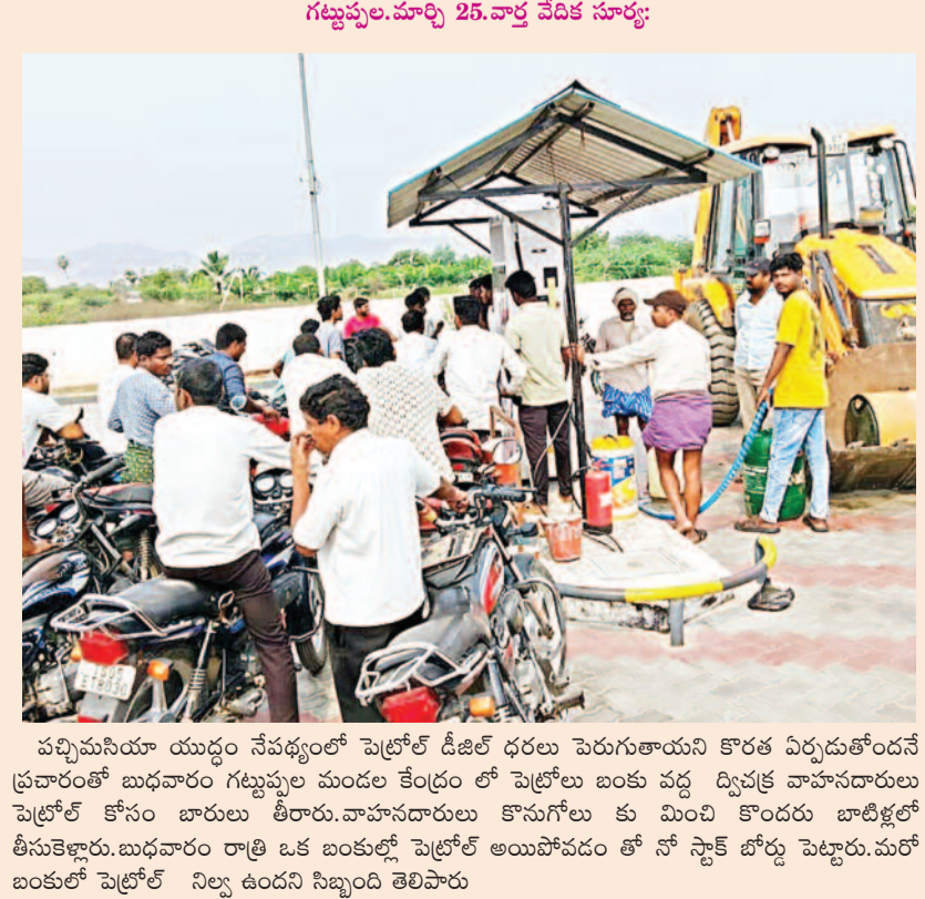
గట్టుపల్లె, మార్చి 25, వార్త వేదిక సూర్య