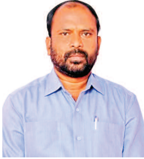
డాఖలు చేయాలని ఆయన డిమాండ్ చేశారు. అణగారిన వర్గాల