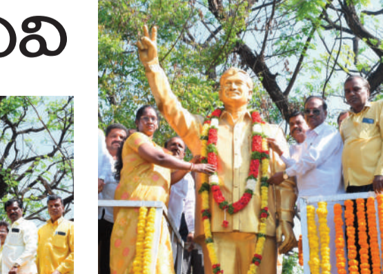
కొండూరు బలయ్య ధర్మోజ్ గూడెం గుర్రం యాదగిరి నేలపట్ల గుర్రం సరసింహ శబగోని వెంకటేశం చివర