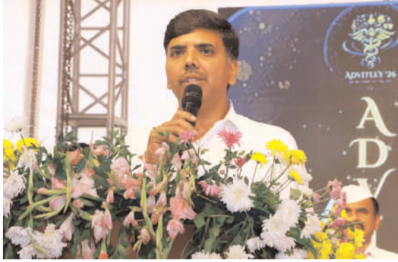
కావాలైన అవసరం ఉందని, అందుకు వైద్య విద్యార్థులు భవిష్యత్తులో మంచి సర్టిఫికేట్లు ఎంచుకొని విజయం సాధించాలని ఆశించారు. అంతకు ముందు జిల్లా కలెక్టర్ ప్రభుత్వ వైద్య కళాశాలలో ఏర్పాటు చేసిన సూతన

నల్లగొండ బ్యారో, ఫిబ్రవరి 28 (వార్తా వేదిక సూర్య) కాబోయే వైద్యులు పట్టణ ప్రాంతం తో పాటు, గ్రామీణ ప్రాంతంలో వైద్య సేవలు అందించడం పై దృష్టి సారించాలని జిల్లా కలెక్టర్ బి. చంద్రశేఖర్ పిలుపునిచ్చారు. శనివారం ఆయన సర్పంచి ప్రభుత్వ వైద్య కళాశాల లో నిర్వహించిన వైద్య కళాశాల వార్షికోత్సవ ముగింపు కార్యక్రమానికి ముఖ్యఅతిథిగా హాజరయ్యారు. పట్టణ ప్రాంతంలో ప్రజలకు 75 శాతం నాణ్యమైన వైద్య సౌకర్యం ఉందని, అందులో 35% మాత్రమే ఉన్నాయన్నారు. ప్రభుత్వపరంగా ఆరోగ్య సదుపాయాలతో పాటు, ప్రాథమిక వైద్యోగ్య కేంద్రాలు, ఆరోగ్య ఉప కేంద్రాలు, అంగన్వాడీ కేంద్రాల ద్వారా వైద్య ఆరోగ్య సేవలు అందిస్తున్నప్పటికీ, ఇంకా 65% మంది గ్రామీణ ప్రాంతంలో ప్రజలు సరైన వైద్యశులు పొందలేకపోతున్నారని, అందువల్ల వైద్యులందరూ గ్రామీణ ప్రాంతంలో వైద్య సేవలు అందించడంపై దృష్టి సారించాలని విజ్ఞప్తి చేశారు. ఎంపీపీఎస్ అంతర్గత చదువని, భవిష్యత్తులో పీజీ, స్పెషలిటీజీఎస్ కి ఇది ఉపయోగపడుతుందని, అంతేకాక ఎంచుకున్న సర్టిఫికేట్ నిష్ణాతులు