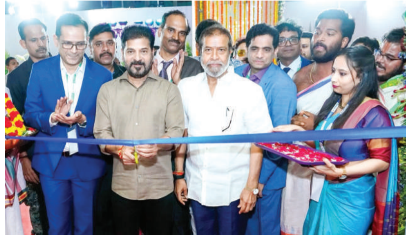
హైదరాబాద్, (వార్త వేదిక సూర్య)-మార్చి 12:

“ఏడాదిలో 11 నెలలు మీ కోసం, మీ కుటుంబం కోసం, మీరు పనిచేస్తున్న సంస్థల కోసం పనిచేయండి. ఒక్క నెల మాత్రం మీకు దగ్గరలో ఉన్న ఏదైనా ప్రభుత్వ ఆస్పత్రిలో పనిచేయడానికి ప్రయత్నించండి. దాని వల్ల మీరు మరింత నేర్చుకునేందుకు అవకాశం లభిస్తుంది. ప్రజలకు మీపై నమ్మకం కలుగుతుంది. ప్రభుత్వాలు మిమ్మల్ని గౌరవించే విధానం మారుతుంది. ఇందుకోసం ఓ వెబ్సైట్ ప్రారంభించున్నాం. మీకు తీరిక దొరికినప్పుడు వచ్చి సేవలందించండి. అందుకు అవసరమైన ఏర్పాట్లు మేం చేస్తాం”