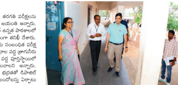
నిర్వహణలో ఎలాంటి నిర్లక్ష్యం అన్నారు. ఈ కార్యక్రమంలో అధికారులు, ఉపాధ్యాయులు పాల్గొన్నారు