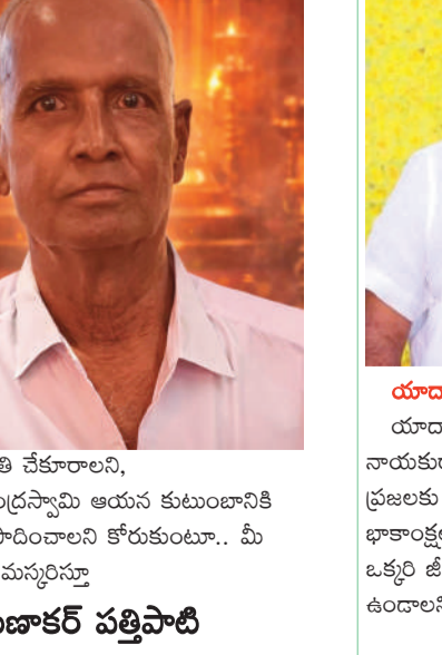
అత్యంత శాంతి చేకూరాలని, సీతారామచంద్రస్వామి ఆయన కుటుంబానికి ధైర్యాన్ని ప్రసాదించాలని కోరుకుంటూ.. మీ పాదాలకు నమస్కరిస్తూ

ఉమ్మడి జిల్లా వ్యాప్తంగా ఎన్నో గ్రామాల్లో ప్రదర్శనలు ఇచ్చి, ఉత్తమ కళాకారుడిగా ఎంతో మంచి మెప్పు పొందారు. ఉమ్మడి కుటుంబానికి అదర్శం నేటి కాలంలో ఉమ్మడి కుటుంబాల కనుమరుగవుతున్న తరుణంలో, ఎన్నో ఏకంగా తన కుటుంబాన్ని ఏకతాటిపై నడిపిస్తూ, ప్రేమాసరాగాలను పంచుతూ ఆయన అదర్శంగా నిలిచారు. వివారరహితంగా, నీతినిజాయితీలకు కట్టుబడిన వ్యక్తిగా ఆయన జీవితం నేటి తరానికి స్ఫూర్తిదాయకం. విధి ఆ మనసున్న మనిషిని మన నుండి దూరం చేసింది. ఆయన శౌచింగా మన దుర్గుణ లోకపోయానా, ఆయన పాడిన కీర్తనలు, ఆయన చేసిన వేషధారణలు తుర్కపల్లి గాలిలో ఎప్పుడీ ప్రతిధ్వనిస్తూనే ఉంటాయి. ఆ పవిత్ర