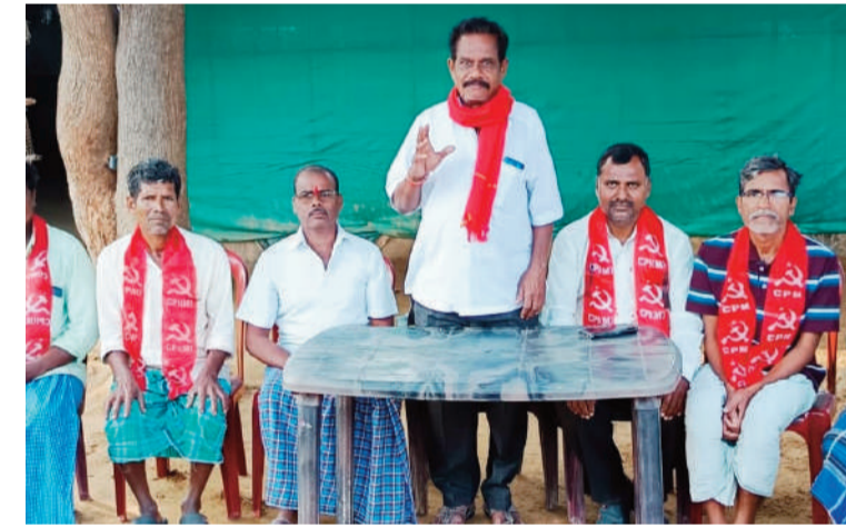
సమస్యల పరిష్కారానికి మండల ప్రజల దశభాగాలు ఎదురు చూస్తున్నారని అన్నారు. గత ఎన్నికల ముందు అనేక హామీలు ఇచ్చి అధికారంలోకి