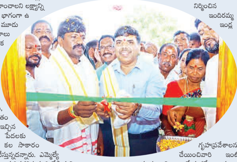
నిర్మించిన ఇందిరమ్మ ఇండ్ల

నకిరేకల్ నియోజకవర్గంలోనే 348 ఇందిరమ్మ ఇండ్ల గృహప్రవేశానికి సిద్ధం చేసినట్లు తెలిపారు. ఇందుకు ఆధికారులు అందరూ సమన్వయంతో పని చేసి, ఇందిరమ్మ ఇళ్ల నిర్మాణాన్ని వేగవంతం చేస్తున్నారని చెప్పారు. ప్రభుత్వం ఇచ్చిన 5 లక్షల రూపాయలు అర్జులైన పేదలకు ఇందిరమ్మ ఇంటి ద్వారా వారి కల సాకారం చేసుకోవడానికి ప్రభుత్వం కృషి చేస్తున్నదన్నారు. ఎమ్మెల్యే సహకారంతో మిగిలిన ఇళ్లను కూడా త్వరితగతినే పూర్తి చేస్తామని తెలిపారు.