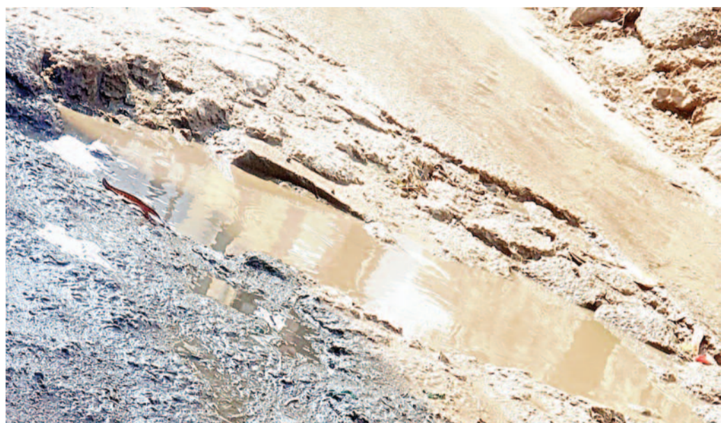
- డ్రైనేజీ వ్యవస్థ అస్తవ్యస్తం.. దుర్గంధంతో ప్రయాణికుల ఇక్కట్లు - తాత్కాలిక మరమ్మత్తులతో కాలక్షేపం చేస్తున్న అధికారులు

అత్యాచార సర్కిల్ పరిధిలోని మైలర్ దేవ్ పల్లి డివిజన్ ఓల్డ్ కర్నూల్ రోడ్డుపై నరకం కనిపిస్తోంది. రాంచరణ్ ఆయిల్ మిల్, శివ సాయి ధర్మ కాటల వరిసరాల్లో డ్రైనేజీ వ్యవస్థ పూర్తిగా నిర్లక్ష్యమైపోయింది. గత కొంతకాలంగా ఇక్కడ మురుగు నీరు రోడ్లపైనే ఏరులై పారుతున్నా, అధికారులు పట్టించుకోవడం లేదని స్థానికులు మండిపడుతున్నారు. ప్రధాన రహదారి వక్కనే నిలిచిపోయిన మురుగు నీరు తీవ్ర దుర్గంధాన్ని వెదజల్లుతోంది. దీంతో అటుగా వెళ్లి పాదచారులు ముక్కు మూసుకుని ప్రయాణించాల్సిన పరిస్థితి నెలకొంది. నిత్యం వందలాది వాహనాలు తిరిగి ఈ మార్గంలో మురుగు నీరు నిలిచి ఉండటంతో వాహనదారులు తీవ్ర అసౌకర్యానికి గురవుతున్నారు. పాదచారులు అడుగు తీసి అడుగు వేయడానికి కూడా భయం గురవుతున్నారు. జీహెచ్ఎస్