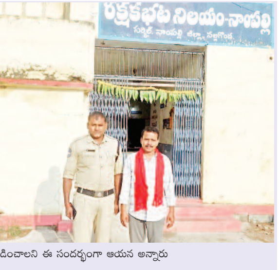
ఖండించాలని ఈ సందర్భంగా ఆయన అన్నారు

నాంపల్లి మార్చి 20 (వార్త వేదిక సూర్య) నల్లగొండ జిల్లా నాంపల్లి మండలం తెలంగాణ అశా వర్కర్స్ యూనియన్ (సిబిటియూ) రాష్ట్ర కమిటీ పిలుపులో భాగంగా మంత్రల గెస్ట్ హౌస్ ల మట్లడి కార్యక్రమానికి తరలి వెళ్తున్న (సిబిటియూ) ఆశ వర్కర్లని అక్రమంగా అరెస్టు చేయడం దుర్మార్గమని ఆయన అన్నారు గ్రామీణ ప్రాంతాల్లో ఆశ వర్కర్లు ఆరోగ్య సమస్యలు నిరంతరం తెలుసుకొని మందులు సరఫరా చేస్తూ ఉన్న గర్భిణి స్త్రీలకు పాపిక్షహారం అందేలా చూస్తున్న ఆశ వర్కర్ల జీవితాల్లో వెలుగులు మాత్రం రావట్లేదని ఆయన అన్నారు కనీస వేతనం 18000 ఆశ వర్కర్లకు ఫిక్స్ వేతనం ఇవ్వాలని పెండింగ్ వేతనాలు ఇవ్వాలని మంత్రల గెస్ట్ హౌస్ ముందుకి వెళుతున్న ఆశ వర్కర్లని సిబిటియూ నాయకులని అక్రమంగా అరెస్టు చేయడం ప్రజాస్వామ్య వాదులు తీవ్రంగా వ్యతిరేకించాలని