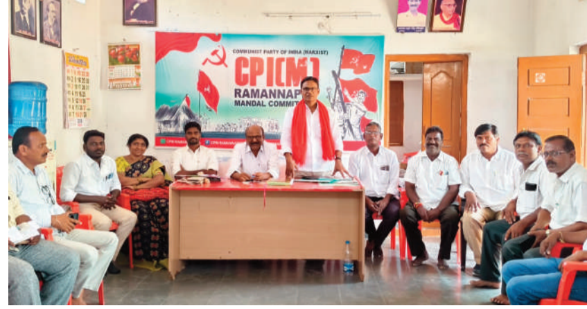
అభివృద్ధికి పాటుపడాలని అన్నారు. నియోజకవర్గానికి అవసరమగు కార్యాలయాలు వైసిపికి స్వరూపం రామన్నపేటకు ఉన్నదని అన్నారు. నియోజకవర్గ సాధన కోసం రాజకీయాలకి