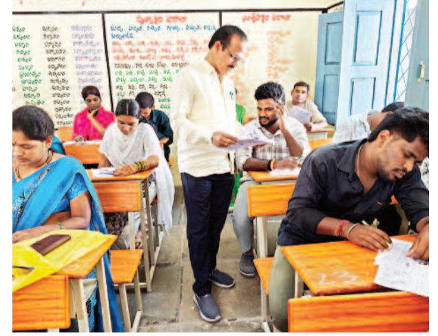
లక్ష్యం. 'అమ్మకు అక్షరమాల' పంది కార్యక్రమాల సమాజంలో సానుకూల మార్పులకు దారి తీస్తాయి అని తెలిపారు.