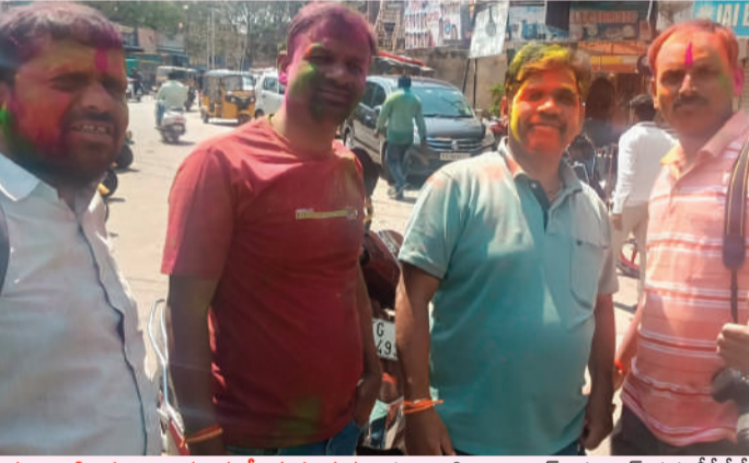
సంగారెడ్డి, మార్చి 4 (వార్త వేదిక సూర్య) :