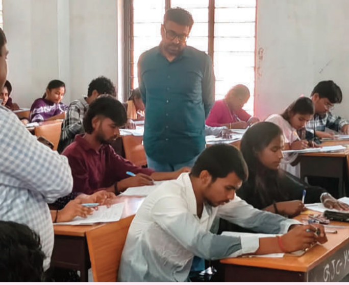
యాదగిరిగుట్ట మార్చి 4 (వార్త వేదిక సూర్య) :

బుధవారం రోజున యాదగిరిగుట్ట లో గల ప్రభుత్వ జూనియర్ కాలేజీ లో జరుగుతున్న ఇంటర్మీడియట్ పరీక్ష కేంద్రాన్ని అదనపు కలెక్టర్ ఆకస్మికంగా తనిఖీ చేశారు. విద్యార్థులు పరీక్షలు రాస్తున్న తీరును నితీతంగా పరిశీలించారు. ఈ సందర్భంగా అదనపు కలెక్టర్ ...మాట్లాడుతూ జిల్లాలో ఇంటర్మీడియట్ పరీక్షలను పక్కలను పక్కలుగా, పారదర్శకంగా నిర్వహిస్తున్నామన్నారు. పరీక్ష కేంద్రాల్లో ఏర్పాటు చేసిన సౌకర్యాలను, సీసీ కెమెరా వ్యవస్థను పరిశీలించారు. ప్రశాంత వాతావరణంలో విద్యార్థులు పరీక్షలు రాసేలా చూడాలన్నారు. మాట్లాడిన కి ఆస్పాదం లేకుండా కట్టుదిట్టమైన చర్యలు తీసుకోవాలని భద్రతా శిలించారు. జవాబు పత్రాల రవాణాకు పటిష్ట భద్రతా చర్యలు తీసుకోవాలని తెలిపారు. పరీక్షలు పూర్తయ్యేంతవరకు విద్యార్థులకు ఎటువంటి ఇబ్బందులూ తలెత్తకుండా చూడాలన్నారు. ఈ కార్యక్రమంలో సిబ్బంది, శ్రమితులు పాల్గొన్నారు.