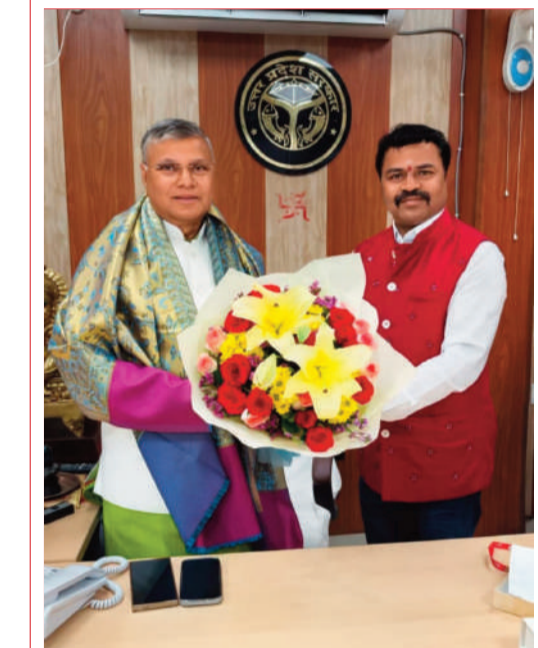
ఉత్తరప్రదేశ్ హోమ్ మినిస్టర్ ధర్మవీర్ ప్రజాపతి ని మార్గదర్శకత్వం కలిగిన మహిళా సంఘం మండల సిరిగిరి పురం గ్రామ మాజీ సర్పంచ్ కాసుల సురేష్, మహిళా సంఘం ఏప్రిల్ 16 వార్త వేదిక సూర్య