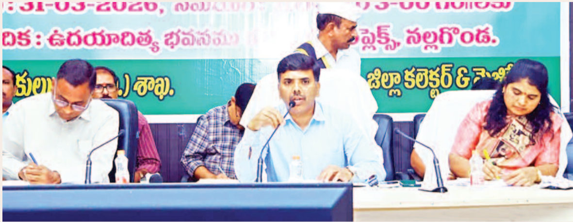
మహనీయుల చరిత్రను తెలియజేసేలా సందేశాలు ఏర్పాటు చేస్తామని,

ఏప్రిల్ నెలలో నిర్వహించుకోనున్న డాక్టర్ బాబు జగ్జీవన్ రామ్, జ్యోతిబాపూలే, డాక్టర్ బి.ఆర్ అంబేద్కర్ జయంతల సేవార్థం ఏర్పాట్ల చేయమై మంగళవారం ఉదయాదిత్య భవన్లో వివిధ సంఘాల ప్రతినిధులతో నిర్వహించిన ముందస్తు సమావేశంలో ఆయన మాట్లాడుతూ.. మహనీయుల జయంతి సందర్భంగా వారిని ఆదర్శంగా తీసుకొని ఆయా వర్గాల అభివృద్ధి, సంక్షేమానికి కృషి చేయాల్సిన అవసరం ఉందని అన్నారు. ఆయా వర్గాల ప్రజల సమస్యల పరిష్కారానికి అందరూ ఆలోచించాల్సిన అవసరం ఉందని చెప్పారు. బాబు జగ్జీవన్ రామ్ జయంతి, అంబేద్కర్ జయంతి లాంటి ఉత్సవాలను గ్రామస్థాయి నుండి మొదలుకొని జిల్లా స్థాయి వరకు నిర్వహించేందుకు సర్కూలర్ జారీ చేస్తామని తెలిపారు. హాల్స్ విద్యార్థులకు నాణ్యమైన విద్యను అందించేందుకు చర్యలు తీసుకుంటామని, విద్యార్థులకు