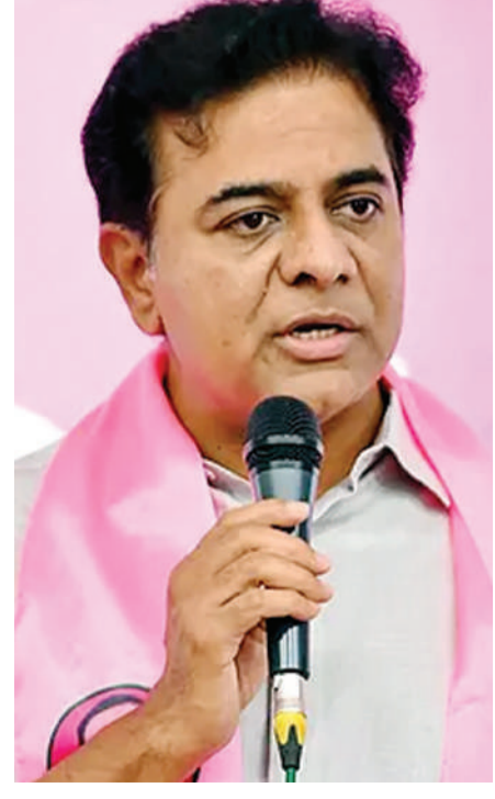
హైదరాబాద్, (వార్త వేదిక సూర్య)-ఏప్రిల్ 4: