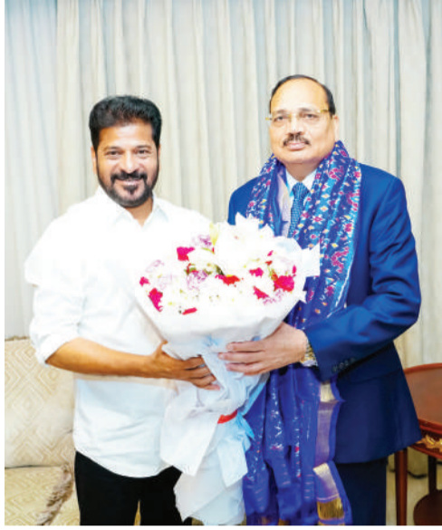
శంకుస్థాపన హైదరాబాద్, (వార్త వేదిక సూర్య)-ఏప్రిల్ 4: