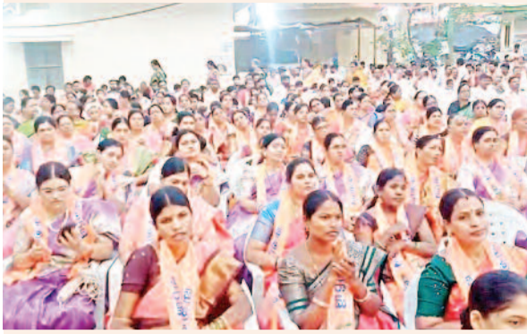
ఘనంగా 'హిందూ సమ్మేళనం'.. భారీగా