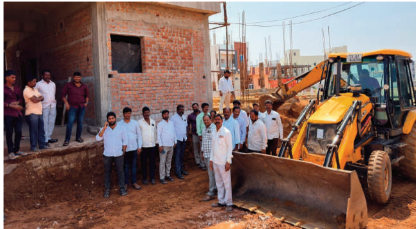
సులకు గ్రామ పంచాయతీ కార్యాలయం నుండి అనుమతులు తీసుకొని నిర్మాణముల పట్టాలని