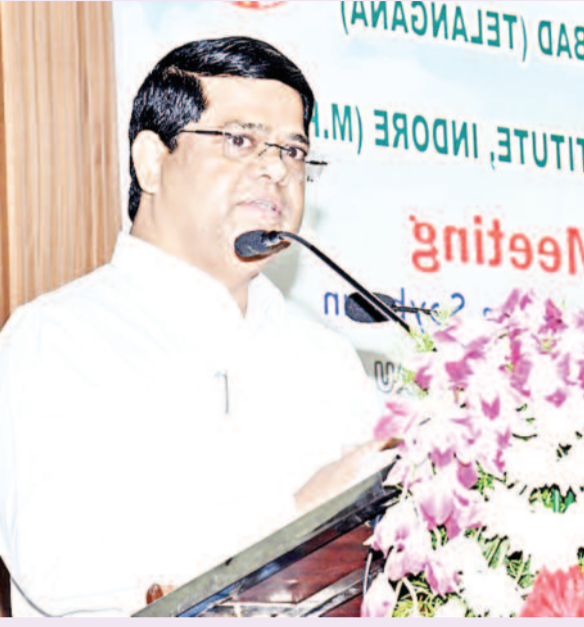
- రెండో రోజు సమావేశాలకు ముఖ్య అతిథిగా వ్యవసాయ శాఖ కార్యదర్శి సురేంద్రమోహన్ హాజరు - 2047 కల్లా 40 మెట్రిక్ టన్నుల ఉత్పత్తి లక్ష్యం