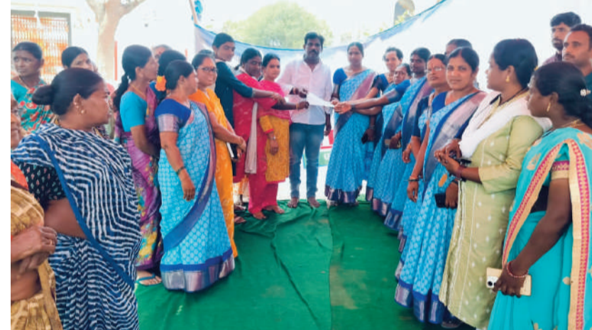
సహకారం అవసరమని తెలిపారు. సమస్య పరిష్కారానికి త్వరితగతిన చర్యలు తీసుకోకపోతే పెద్ద ఎత్తున ఆందోళనలు చేపడతామని మహిళలు హెచ్చరించారు. గ్రామ ప్రజల సంక్షేమం కోసం బెల్ట్ షాపుల నిర్మూలన అత్యవసరమని స్పష్టం చేశారు.

గుండాల, ఏప్రిల్ 08 (వార్త వేదిక సూర్య) : సుద్దాల గ్రామంలో ప్రజా ఆరోగ్యం, కుటుంబాల ఆర్థిక భద్రత దృష్ట్యా బెల్ట్ షాపులను రద్దు చేయాలని మహిళా సంఘాలు డిమాండ్ చేశాయి. గ్రామంలో అత్యధికంగా నడుస్తున్న మధ్యం విక్రయాల కారణంగా అనేక కుటుంబాలు తీవ్ర ఇబ్బందులు ఎదుర్కొంటున్నాయని మహిళలు ఆవేదన వ్యక్తం చేశారు. ముఖ్యంగా రోజువారీ కూలీలు సంపాదించే డబ్బూ మధ్యం కోసం ఖర్చవుతూ, కుటుంబాల ఆర్థిక పరిస్థితి దెబ్బతింటోందని తెలిపారు. ఈ సమస్య వల్ల