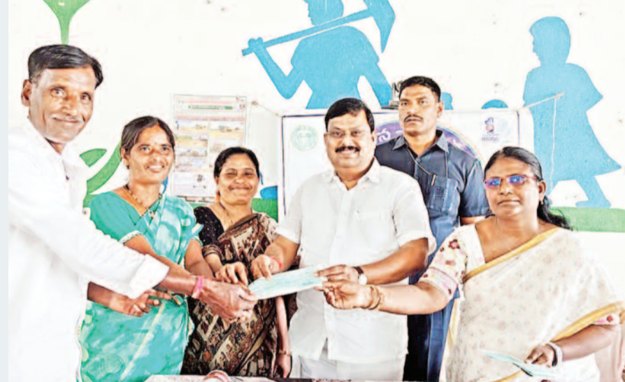
రైతుల సంక్షేమమే ప్రజా ప్రభుత్వం ప్రధాన ధ్యేయం.