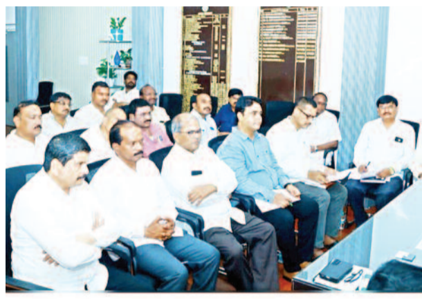
ఎలాంటి కొల్లీలు లేకుండా ధాన్యం దిగుమతి తీసుకోవాలి..!

సంబంధిత శాఖల అధికారులతో సమావేశం రైస్ మిల్లర్లకు జిల్లా కలెక్టర్ కీలక ఆదేశం..