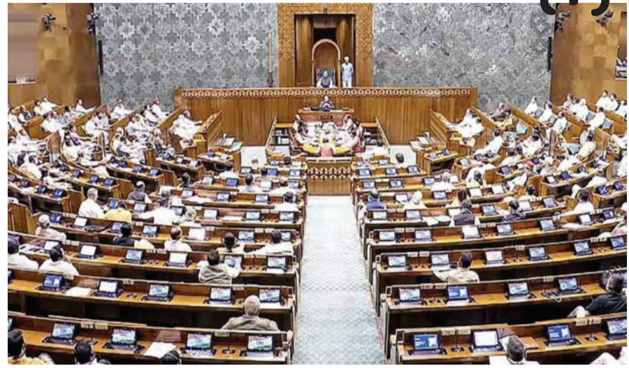
లోకసభలో విగిపోయిన తర్వాత ఎన్డీయే కుటమి మంత్రులు, నేతలు భేటీ అయ్యారు. కేంద్ర మంత్రులు జేపీ నడ్డా, ధర్మేంద్ర ప్రధాన్, అర్జున్

న్యూఢిల్లీ: మహిళా రిజర్వేషన్ల బిల్లు లోకసభలో విగిపోయిన క్రమంలో ప్రతిపక్షాల చర్యలు ఎండగడుతూ చేకవ్యాప్తంగా ఎన్డీయే పక్షాలు నిరసనలు చేపట్టనున్నాయి. మహిళా సాధికారతకు ఉద్దేశించిన బిల్లును ప్రతిపక్షాలు ఉద్దేశపూర్వకంగా అడ్డుకున్నాయని ఆరోపిస్తూ ఈ నిరసనలు నిర్వహించనున్నాయి. మహిళా రిజర్వేషన్ల కోసం కేంద్రం ప్రవేశపెట్టిన రాజ్యాంగ సవరణ బిల్లు