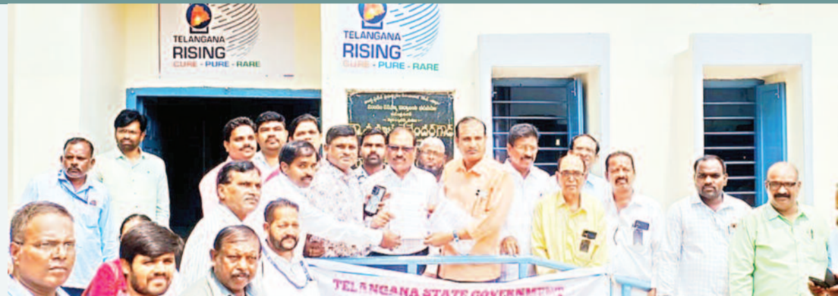
పాత పెన్షన్ విధానాన్ని పునరుద్ధరించాలి. పదవీ విరమణ పొందిన ఉద్యోగుల పెండింగ్ బిల్లులను తక్షణమే చెల్లించి వారిని ఆదుకోవాలి. సాధారణ బదిలీలు చేపట్టాలని, వీఆర్ఎల సమస్యలను పరిష్కరించడంతో పాటు జిబ్బెస్కో డిమాండ్లకు ఉద్యోగ భద్రత కల్పించాలని డిమాండ్ చేశారు.