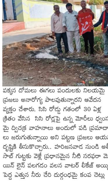
పెరిగి పండులకు, వివ సర్కాలకు నిలయంగా మారిందన్నారు గుంటలో పండులు పడి చనిపోయి దురాసనంతో వీధిలోని ప్రజలు నానా ఇబ్బందులు పడుతున్నారు. అంతేకాకుండా చేతి పంపు మరమ్మతులు పేరిట ఊడబీక్ స్పీర్ పార్ట్ వక్కువ వడేసి చేతులు దులుపుకున్నారు అని విమర్శించారు. అల్లి విడిభాగాలను గుర్తు తెలియని వ్యక్తులు ఎత్తుకొనినా అది పట్టించుకునే నాణ్యుడే లేకపోయాడు అని పేర్కొన్నారు. రామన్న ఎం కాం దృష్ట్యా చేతిపంపు మరమ్మతులు