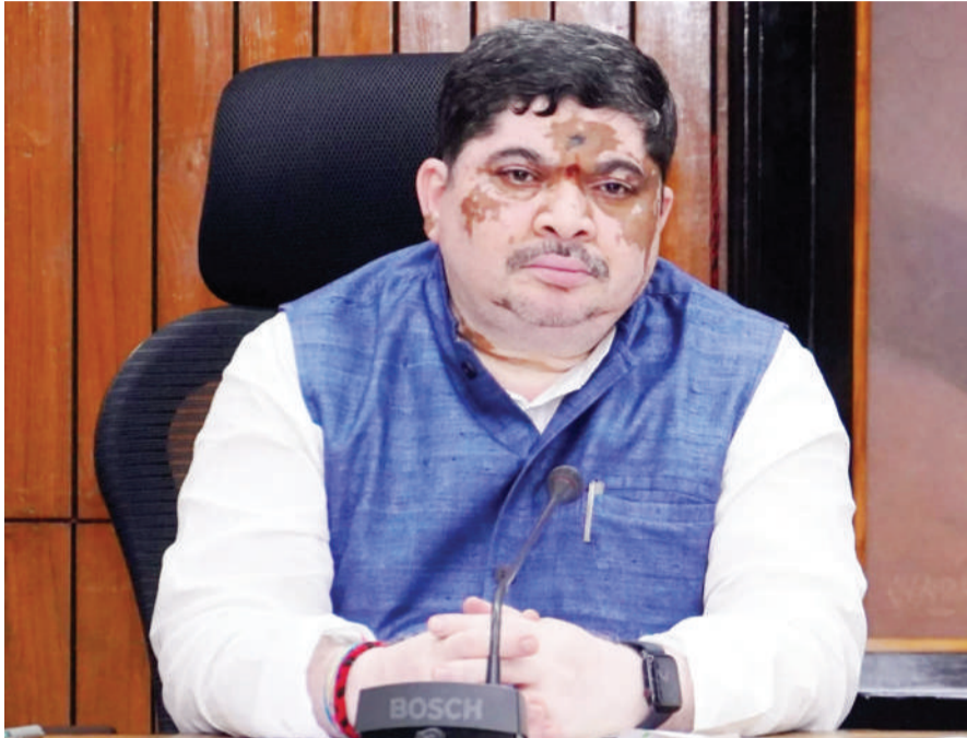
ఒప్పుకున్నారు అని అంటున్నారు. తేజస్వీ మాటలు రికార్డుల నుండి తొలగించకపోతే కీషన్ రెడ్డి, బండి సంజయ్, స్థానిక ఎంపీ డీకే అరుణ మీరు తెలంగాణ ద్రోహులుగా మిగులుతారు. ఇది రాజకీయం కాదు తెలంగాణ ఆత్మగౌరవం తెలంగాణ కోసం కాళ్ళ మొక్కినట్లం.. పార్లమెంట్ లో కొట్టడినట్లం తెలంగాణ కు అన్యాయం జరిగితే చూస్తూ ఉరుకోం

బీజేపీ అధ్యక్షుడు రామచంద్రరావు, కేంద్ర మంత్రులు కీషన్ రెడ్డి, బండి సంజయ్ కాకినాడ తీర్మానం లో ఒక ఓటు రెండు రాష్ట్రాలు అన్నది ఎవరు. మీ వల్లే తెలంగాణ అలంకరిం అయింది. మార్గదర్శకులు తెలంగాణ విభజన ను వ్యతిరేకించిన స్వయంగా అదానీ లో చరించి సోనియా గాంధీ తెలంగాణ రాష్ట్రాన్ని ఏర్పరిచారు. తెలంగాణ రాష్ట్ర కోసం రాజీనామా చేయమని అంటే పారిపోయిన వ్యక్తి కీషన్ రెడ్డి తేజస్వీ సూర్య తప్పుయింది అని