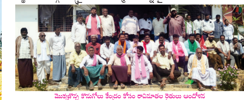
మొక్కకొన్న కొనుగోలు కేంద్రం కోసం రావిపూతల రైతులు ఆందోళన

యాసంగిలో పెద్ద మొత్తంలో పండించిన మక్కల అమ్మకాలకు అన్నదాతలు అరిగోస ప