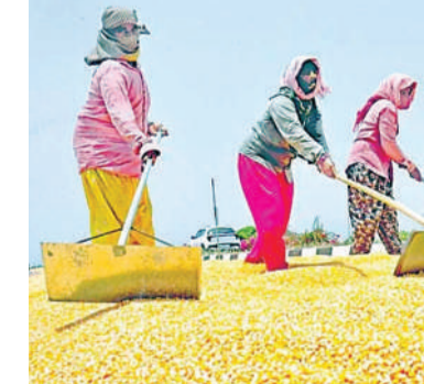
వరంగల్/హైదరాబాద్, (వార్త వేదిక సూర్య)-ఏప్రిల్ 23:

యాసంగిలో పెద్ద మొత్తంలో పండించిన మక్కల అమ్మకాలకు అన్నదాతలు అరిగోస ప