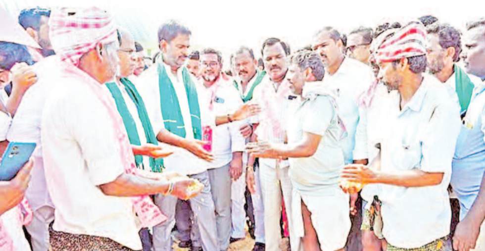
నిర్లక్ష్యంతో మక్కలను కొనుగోలు చేయడంలేదని, దీంతో వర్షానికి తడిచి ముద్దులందని, తడిచిన ధాన్యం సైతం కొనుగోలు చేయాలని డిమాండ్ చేశారు. కలెక్టర్ వచ్చి హామీ ఇచ్చి వరకు అందోళన విరమించేది లేదని భీష్మించారు. గంటసేపు అందోళన కొనసాగడంతో వాహనాలు పెద్ద ఎత్తున నిలిచిపోయాయి. కలెక్టర్ తో ఎదుట ఉద్రిక్తత