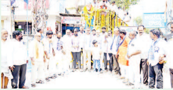
ఆలోచనలు ప్రతి ఒక్కరికీ మార్గదర్శకమని అన్నారు. ఈ కార్యక్రమంలో అంబేద్కర్ ఉత్సవ కమిటీ సభ్యులు, నియోజకవర్గంలోని బీజేపీ నాయకులు, కార్యకర్తలు మరియు అంబేద్కర్ అభిమానులు పెద్ద సంఖ్యలో పాల్గొన్నారు.