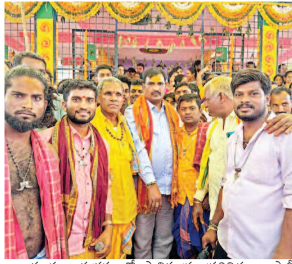
ఇచ్చారు. ఈ కార్యక్రమంలో స్థానిక ప్రజాప్రతినిధులు, పార్టీ నాయకులు, అధికారులు, గ్రామ పెద్దలు మరియు పెద్ద సంఖ్యలో