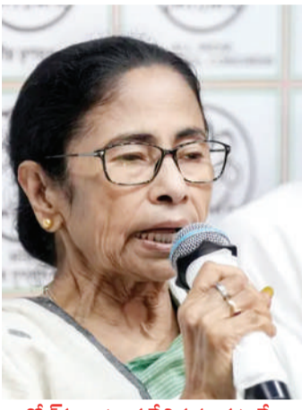
కోల్ కతా, (వార్త వేదిక సూర్య)-మే5: