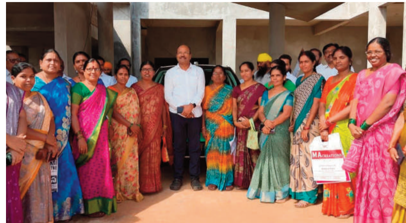
చేశారు. మహాలక్ష్మి, ఉచిత బస్సు ప్రయాణం, ఇందిరా మహిళా శక్తి కళ్యాణలక్ష్మి అనేక ఇందిరమ్మ ఇళ్లు, సోలార్ ఫ్లాంటు, గృహజ్యోతి, పథకాలు అమలు చేస్తున్నట్లు తెలిపారు.

వరకు ఇచ్చే వడ్డీ లేని రుణాలను తెలంగాణ ప్రభుత్వమే భరిస్తుందని ఆయన చెప్పారు. దాదాపు వడ్డీలే రూ.2500కోట్లను వెల్లించనుంది. 2026-27 ఆర్థిక సంవత్సరంలో దాదాపు రూ.27వేల కోట్ల వడ్డీ లేని రుణాలు అందించేందుకు ప్రభుత్వం ప్రణాళికలు సిద్ధం చేసిందని స్పష్టం చేశారు. వడ్డీ వ్యాపారుల కోరల నుంచి రక్షించేందుకు ప్రభుత్వం చర్యలు చేపట్టిందన్నారు. స్వయం సహాయ బృందాలు చిరు వ్యాపారంతో ఉన్నత స్థితికి రావాలని లక్ష్యార్థి అకాంక్షించారు. మొత్తం 4.37లక్షల స్వయం సహాయ బృందాల్లో దాదాపు 46 లక్షల 68 వేల మంది నభ్యులు ఉన్నారు. ఇప్పటికే సీఎం రేవంత్ రెడ్డి, అధికారంలోకి వచ్చాక ఆడపడుచులకు అనేక సంక్షేమ పథకాలు అమలు చేస్తున్నట్లు గుర్తు