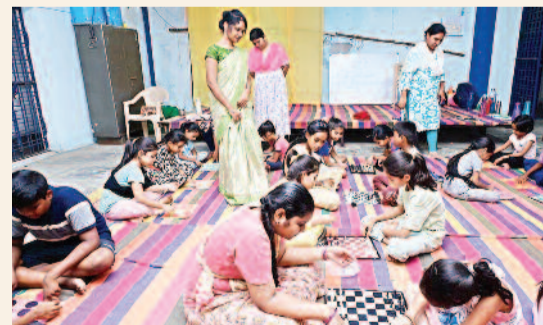
నల్గొండ జ్యూరో, మే 8 (వార్త వేదిక సూర్య)

నల్గొండ పట్టణంలో చిన్నారుల సమగ్ర అభివృద్ధికి దోహదపడే విధంగా 45 రోజుల ప్రత్యేక సమ్మర్ క్యాంప్ ప్రారంభం కానుంది. వేసవి సెలవులను సాధ్యంగా వినియోగించుకునేలా ఈ క్యాంప్ ను రూపకల్పన చేసినట్లు నిర్వాహకులు తెలిపారు. ఈ క్యాంప్ లో పిల్లలకు చదువు మాత్రమే కాకుండా విలువల బోధన, ఆటలు, ఆలోచన శక్తి పెంపొందించే కార్యక్రమాలు నిర్వహించనున్నారు. ఉదయం 7 గంటల నుంచి 8 గంటల వరకు, సాయంత్రం 6 గంటల నుంచి 7.30 గంటల వరకు తరగతులు కొనసాగుతాయి. క్యాంప్ లో కూచిపూడి, భగవద్దత్త పఠనం, స్మార్ట్ మాక్యూట్ పజిల్స్, ట్రెయిన్ బాస్కెట్ గేమ్స్, శారీరక దృఢత్వానికి వ్యాయామాలు, మానసిక మోసానికి ప్రత్యేక సెషన్లు, సంస్కృతిక విలువలు, జీవన నైపుణ్యాలపై శిక్షణ ఇవ్వబడుతుంది. పిల్లల సంపూర్ణ అభివృద్ధిని దృష్టిలో ఉంచుకుని రూపొందించిన ఈ క్యాంప్ కు తల్లిదండ్రుల నుంచి మంచి స్పందన లభిస్తున్నట్లు నిర్వాహకులు పేర్కొన్నారు. సీట్లు పరిమితంగా ఉండటంతో ఆసక్తి గల వారు వెంటనే నమోదు చేసుకోవాలని సూచించారు. షీజు వివరాల ప్రకారం ఉదయం సెషన్ కు రూ.1500, సాయంత్రం సెషన్ కు రూ.1500గా నిర్ణయించారు.