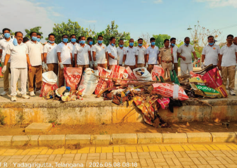
T R | Yadagirigutta, Telangana | 2026.05.08 08:18