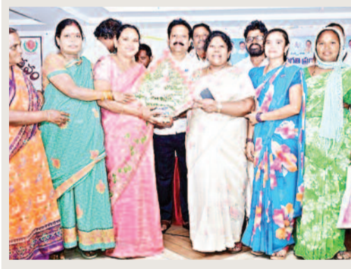
నల్గొండ జ్యూరో, మే 8 (వార్త వేదిక సూర్య)