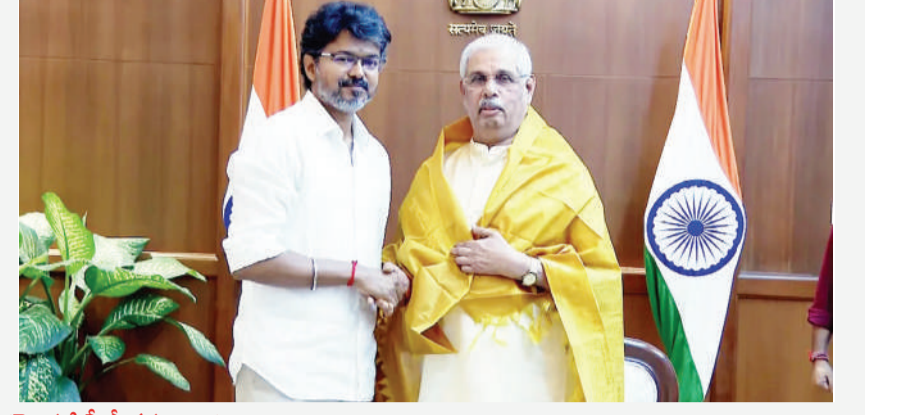
(మొదటి సీజ్ తరువాత)