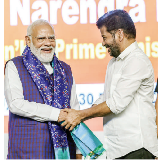
హైదరాబాద్, (వార్త వేదిక సూర్య) మే 10:

మూసీ పునరుజ్జీవం, మెట్రో, రేడియల్ రోడ్లు, హైదరాబాద్-బందరు రోడ్డుకు అనుమతివ్వండి ఇందుకోసం రెండు గంటలు కేటాయించి సమీక్షించండి తెలంగాణ ప్రాజెక్టులను ఆమోదించేందుకు పీఎంవోలో ప్రత్యేక సింగిల్ విండో టాస్క్ఫోర్స్ ఏర్పాటు చేయండి 2047నాటికి 3 టీలియన్ డాలర్ల ఆర్థిక వ్యవస్థ లక్ష్యం ఇది కేంద్ర కార్యక్రమం కాదు.. అభివృద్ధి ఉత్సవం ప్రధాని మోదీ పాల్గొన్న కార్యక్రమంలో ముఖ్యమంత్రి రేవంత్ రెడ్డి విజ్ఞప్తి