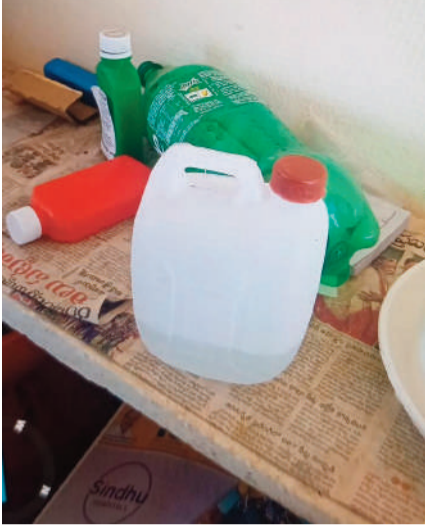
చేసే వారిపై కఠిన చర్యలు తీసుకుంటామని పోలీసులు హెచ్చరించారు.