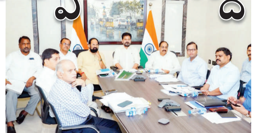
హైదరాబాద్, (వార్త వేదిక సూర్య) మే12:

ధాన్యం సేకరణ, మొక్కజొన్న కొనుగోళ్ల విషయంలో నిర్లక్ష్యం వహిస్తే సహాయం చేయని ముఖ్యమంత్రి రేవంత్ రెడ్డి స్పష్టం చేశారు. ధాన్యం లోడ్ తరలింపేందుకు ఒప్పందం మేరకు సరిపడా లారీలు అందుబాటులో ఉంచని కాంట్రాక్టర్లను ముగ్గురిని.. అవసరమైతే అలాంటి వారిపై క్రిమినల్ కేసులు వెనకాడవద్దని ముఖ్యమంత్రి ఆదేశించారు. మొక్కజొన్న పంట ఎక్కువగా వచ్చే జిల్లాల కలెక్టర్ల కొనుగోళ్ల విషయంలో అప్రమత్తంగా ఉండాలన్నారు. ఎక్కడా రైతులకు ఇబ్బందులు కలగొద్దని తెలిపారు. అవసరమైన చోట పోలీస్ సహాయం తీసుకుని కలెక్టర్లు ధాన్యం సేకరణ సాఫీగా జరిగేలా చూడాలని