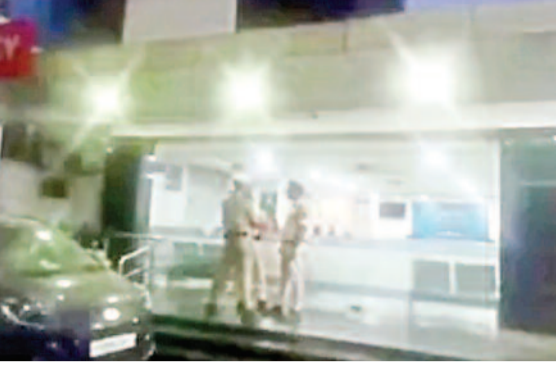
యువతి కిడ్నాప్? నలుగురు యువకుల ఘాతుకం: థార్ కారులో బలవంతంగా అవహరణ

రాజేంద్రనగర్ సర్కిల్ పరిధిలోని అత్తాపూర్లో మంగళవారం అర్ధరాత్రి ఘోర వికృతం చోటుచే సుకుంది. ఓ యువతిని నలుగురు గుర్తుతెలియని యువకులు బలవంతంగా కారులో ఎక్కించుకుని అవహరించుకుపోయిన ఘటన స్థానికంగా తీవ్ర భయాందోళనలు రేకెత్తించింది. స్థానికులు అప్రమత్తం. పోలీసుల చేజిగి పోలీసులు మరియు స్థానికుల కథనం ప్రకారం... అర్ధరాత్రి సమయంలో పిఎస్ఆర్ ఎక్స్ ప్రెస్ నెంబర్ 143 సమీపంలో ఒక యువతి వెళ్తుండగా, నంబర్ ప్లేట్ లేని నలుపు రంగు థార్ కారులో వచ్చిన నలుగురు యువకులు ఆమెతో ఘర్షణకు దిగారు. యువతి ప్రతిఘటించినప్పటికీ, ఆమెను బలవంతంగా కారులోకి లాగి వెళ్లగా దూసుకెళ్లారు. ఈ దృశ్యాన్ని గమనించిన స్థానికులు తక్షణమే స్పందించి 'డయల్ 100' ద్వారా పోలీసులకు సమాచారం అందించారు. సమాచారం అందుకున్న వెంటనే అత్తాపూర్ పోలీస్ పోలీసులు