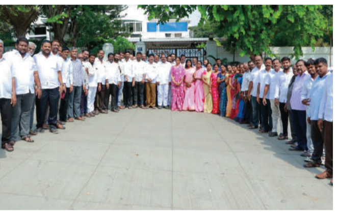
హెచ్ఎంఎంఎస్ అధ్యక్షులతో ప్రతి కుటుంబానికి 20 లీటర్ల ఉచిత మంచినీటి సరఫరా అందేలా చర్యలు తీసుకోవాలని కోరారు. ప్రజలకు సంబంధించిన ఈ సమస్యలను సానుకూలంగా పరిశీలించి తగిన చర్యలు తీసుకుంటామని మంత్రి శ్రీధర్ బాబు, హామీ