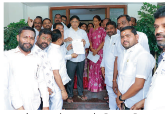
ప్రజల ఆరోగ్యాన్ని దృష్టిలో ఉంచుకుని జీహెచ్ ఎస్సీ అధ్యక్షులతో పబ్లిక్ స్మిటింగ్ పూల్ నిర్మాణానికి అనుమతులు ఇవ్వాలని మంత్రి దృష్టికి తీసుకెళ్లారు. అల్వాసిగూడ ప్రాంతంలో కస్టర్డన్ గ్రీన్ జోన్ రెసిడెన్షియల్ జోన్ కు సంబంధించిన హెచ్ఎండివి మాస్టర్ ప్లాన్ సమస్యలను పరిష్కరించాలని, ముఖ్యంగా షేమ్ ప్రాంతాలలో