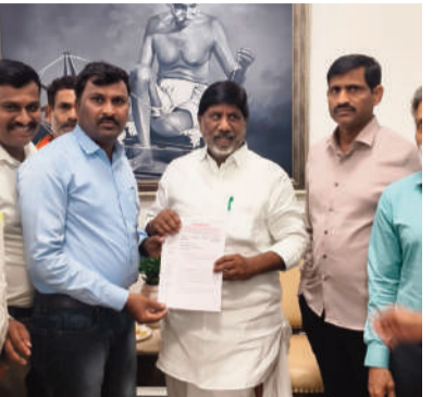
అధ్యక్షులు డాక్టర్.ఆవుల సైదులు కృతజ్ఞతలు తెలిపారు.