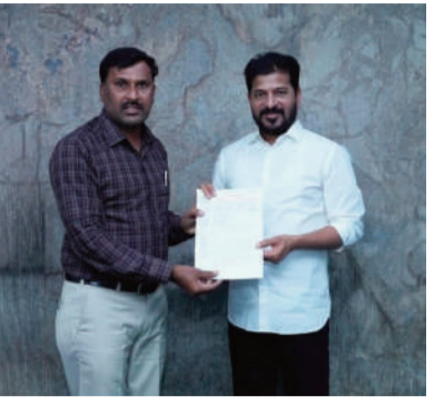
మంత్రి , ప్రభుత్వ ప్రధాన కార్యదర్శి, ఎస్సీ అభివృద్ధి శాఖ ముఖ్య కార్యదర్శి, ఎస్సీ గురుకుల కార్యదర్శి ఇతర ఉన్నతాధికారులకు డి.జి.ఎస్.డబ్ల్యు.ఆర్.ఇ.టి.ఎల్.ఎ రాష్ట్ర

మంత్రి, ముఖ్యమంత్రి, ఉపముఖ్యమంత్రిలకు సమర్పించిన వినతి పత్రాలను పరిశీలించిన అధికారులు ప్రభుత్వ ఉద్యోగులు జిల్లా పరిషత్ పాఠశాలలో పనిచేస్తున్న ఉపాధ్యాయులతో పాటు అన్ని రకాల గురుకుల విద్యాలయాల సంస్థల పరిధిలో పనిచేస్తున్న గురుకుల ఉపాధ్యాయులకు కూడా హెల్త్ కార్డ్స్ సౌకర్యం కల్పిస్తూ మంగళవారం నాడు మేమా నెం.373 9367 తో ఆర్థిక శాఖ ఉత్తర్వులు జారీ చేసింది. ప్రభుత్వ ఆదేశాల ప్రకారం గురుకుల ఉపాధ్యాయులకు నగదు రహిత హెల్త్ కార్డ్స్ జారీ చేయటం కావలసిన వివరాలు ఉన్నతాధికారులు వెంటనే ఉపాధ్యాయుల నుండి సేకరించాలని విజ్ఞప్తి చేశారు. ఈ సందర్భంగా ముఖ్యమంత్రి , రేవంత్ రెడ్డి, ఉపముఖ్యమంత్రి బద్దీ విక్రమార్క , సాంఘిక సంక్షేమ శాఖ