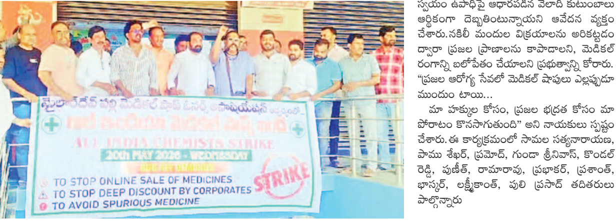
మైలార్ దేవ్ పల్లి మెడికల్ షాప్ ఓన్లైన్ అసోసియేషన్ ఆధ్వర్యంలో నిర్వహించిన అల్ ఇండియా కెమిస్ట్రీ డ్రైక్ కు స్థానిక మెడికల్ షాప్ యజమానులు భారీగా మద్దతు తెలిపారు. ప్రజల