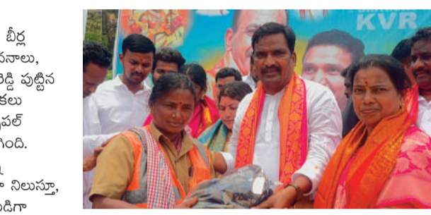
మరియు మహిళలు పెద్ద ఎత్తున పాల్గొని జన్మదిన శుభాంక్షలు తెలిపారు.