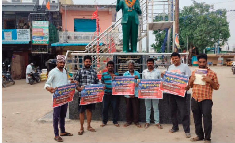
తిరిగి ప్రజల ప్రయోజనాల కోసమే ప్రదర్శించాలనే బలమైన సంకల్పంతో 1943 మే 25న బొంబాయి నగరంలో ఇండియన్ పీపుల్స్ థియేటర్ అసోసియేషన్ ఆవిర్భవించినది ఆయన గుర్తుచేశారు. ఒకవైపు ప్రపంచాన్ని నాణ్యమైన, యుద్ధ మేపాలు కమ్మేస్తుండగా.. మరోవైపు భారతదేశంలో తెల్లదొరల ఆగడాలు, కరువు కాటకాలు