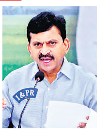
మంత్రి పొంగులెలి రాష్ట్ర క్యాబినెట్లో ప్రకటనలు చేస్తున్నారు.