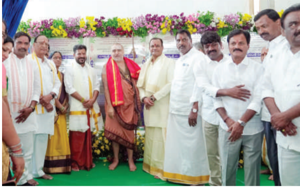
యాదాద్రిగుట్టలో వేద పారశాలకు శంకుస్థాపన చేసిన సీఎం రేవంత్.

యాదాద్రిగుట్టలో సీఎం రేవంత్ రెడ్డి పర్యటన సందర్భంగా రూ.100 కోట్లతో అభివృద్ధి పనులకు శంకుస్థాపన చేశారు. శనివారం ఉదయం యాదాద్రిగుట్టకు చేరుకున్న సీఎం రేవంత్ శ్రీలక్ష్మీనర్సింపా స్వామిని దర్శించుకున్నారు. అనంతరం రూ.43.80 కోట్లతో నిర్మించనున్న వేద