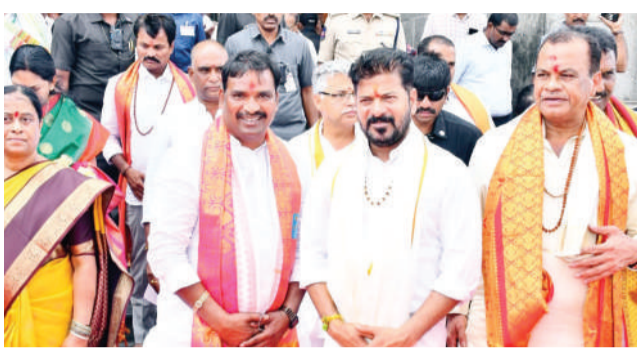
శ్రీలక్ష్మీ నరసింహస్వామి వారిని సీఎం రేవంత్ సందర్శించారు.