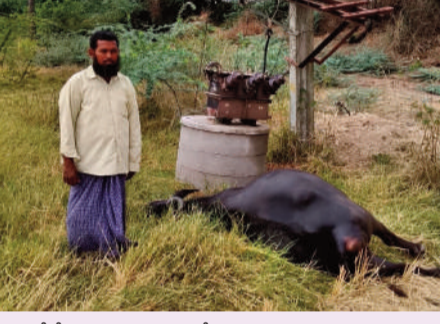
గేదె మృతి చెందడంతో రైతు కన్నీరుమున్నీరయ్యారు. గేదె విలువ సుమారు రూ.80 వేలు ఉంటుందని, ప్రభుత్వపరంగా తనకు ఆర్థిక సాయం అందించి ఆదుకోవాలని బాధితు రైతు ప్రభుత్వాన్ని కోరారు.

మోతూరు, (అడ్డగూడూరు): మే 27 (వార్త వేదిక సూర్య): విద్యుత్ షాక్ తో గేదె మృతి చెందిన సంఘటన అడ్డగూడూరు మండల కేంద్రంలో బుధవారం చోటుచేసుకుంది.