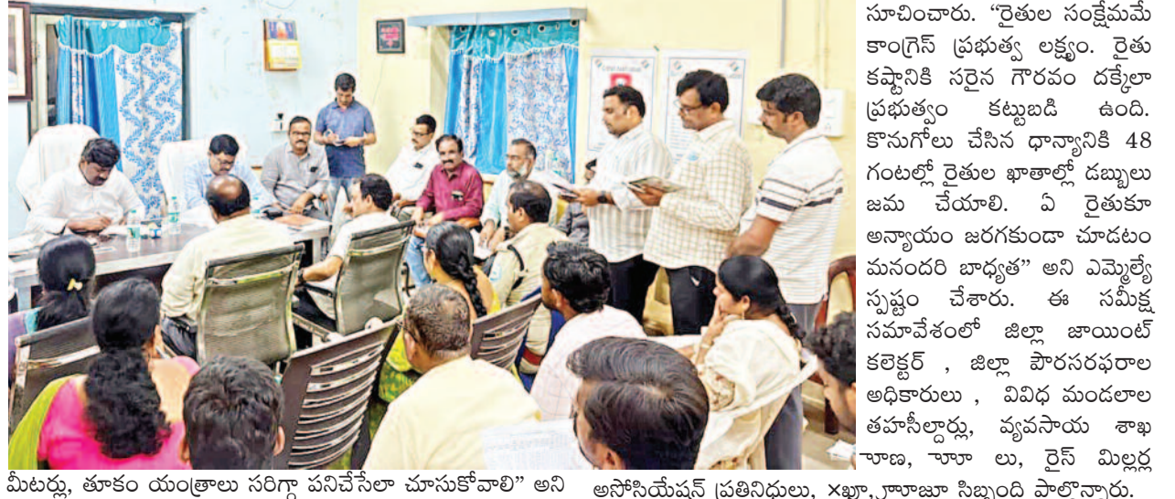
మీటర్లు, తూకం యంత్రాలు సరిగ్గా పనిచేసేలా చూసుకోవాలి" అని ఆసోసియేషన్ ప్రతినిధులు, Xఖా, గ్రామీణులు నిబ్బంది పాల్గొన్నారు.

నకిరేకల్ పట్టణంలోని తహసీల్దార్ కార్యాలయంలో సోమవారం నియోజకవర్గ పరిధిలోని అన్ని మండలాలకు సంబంధించిన ధాన్యం కొనుగోలు ప్రక్రియపై ప్రభుత్వ విప్, నకిరేకల్ ఎమ్మెల్యే శ్రీ వేముల వీరేశం గారు సమీక్ష సమావేశం నిర్వహించారు. నకిరేకల్, కట్టంగూర్, కేతేపల్లి, నార్కెట్ పల్లి, చిటూలు, రామన్న పేట మండలాల్లో ఏర్పాటు చేసిన ధాన్యం కొనుగోలు కేంద్రాల పనితీరు, రోజువారీ కొనుగోళ్లు, రైస్ మిల్లులకు తరలింపు, రైతులకు చెల్లింపులపై ఎమ్మెల్యే అధికారులతో సమీక్షించారు. ఈ సందర్భంగా ఎమ్మెల్యే అధికారులను ఆదేశిస్తూ "ధాన్యం కొనుగోలు కేంద్రాలలో రైతులకు ఎలాంటి ఇబ్బందులు తలెత్తకుండా ముందస్తు చర్యలు తీసుకోవాలి. రైతులు తీసుకొచ్చిన ధాన్యాన్ని తక్షణమే కొనుగోలు చేసి, ఎలాంటి ఆలస్యం లేకుండా మిల్లులకు తరలింపాలి. గన్నీ బ్యాగులు, తేమ కొలిచే