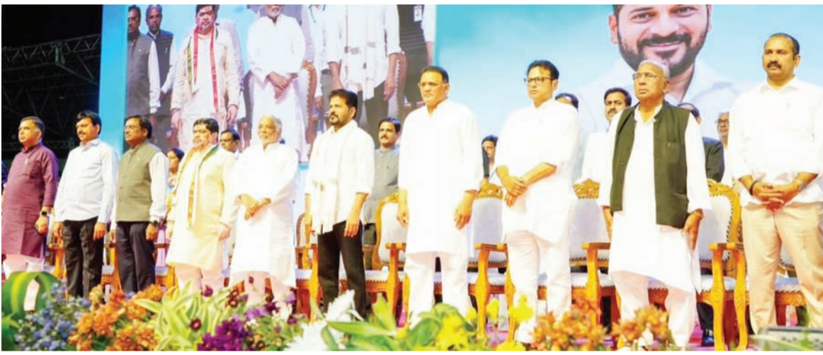
హైదరాబాద్, (వార్త వేదిక సూర్య) మే 11:

• టీచర్లు గంట అధనంగా పనిచేయాలి • విదేశీ టూర్లకు 500 మంది టీచర్లను పంపిస్తాం • ఇకపై జూన్ 2న ఉత్తమ టీచర్లకు పురస్కారం, సన్మానం • కులాలికో రెసిడెన్షియల్ పాఠశాలలో పెరుగుతున్న కులవివక్ష • కులవివక్షను రూపు మాపించుకొనే ఇంటిగ్రేటెడ్ స్కూళ్లు • విద్యారంగ అభివృద్ధి కోసమే ఆ శాఖను పర్యవేక్షిస్తున్నా • విద్యా వారోత్సవాల ప్రారంభ సభలో సిఎం రేవంత్ రెడ్డి