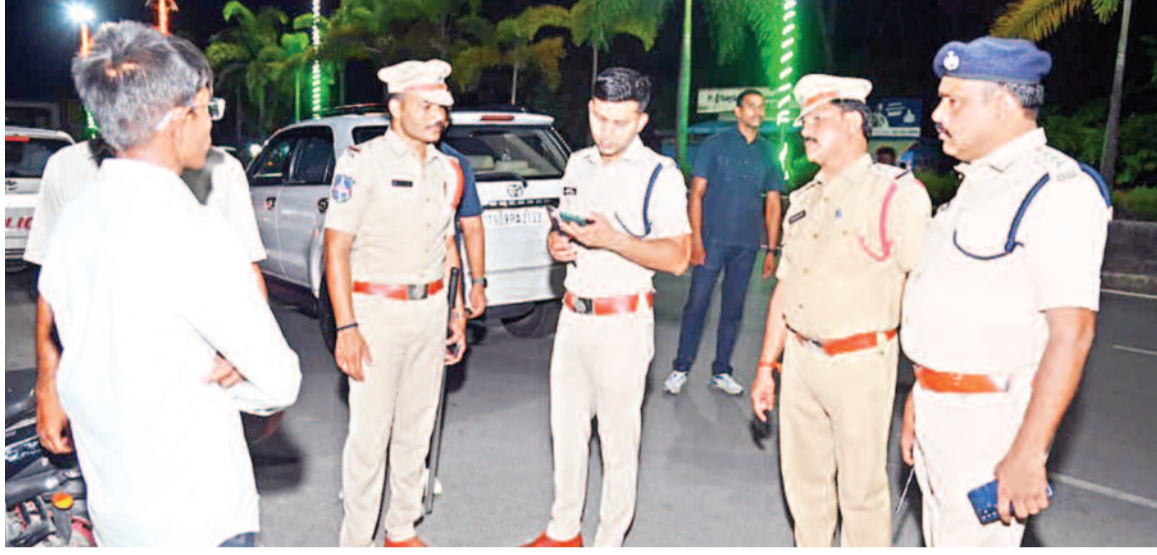
దాదాపు 1500 మంది పోలీసు సిబ్బంది తో ప్రత్యేక తనిఖీలు..

అనుమానస్పద వాహనాలు, వ్యక్తుల పై ప్రత్యేక నిఘా