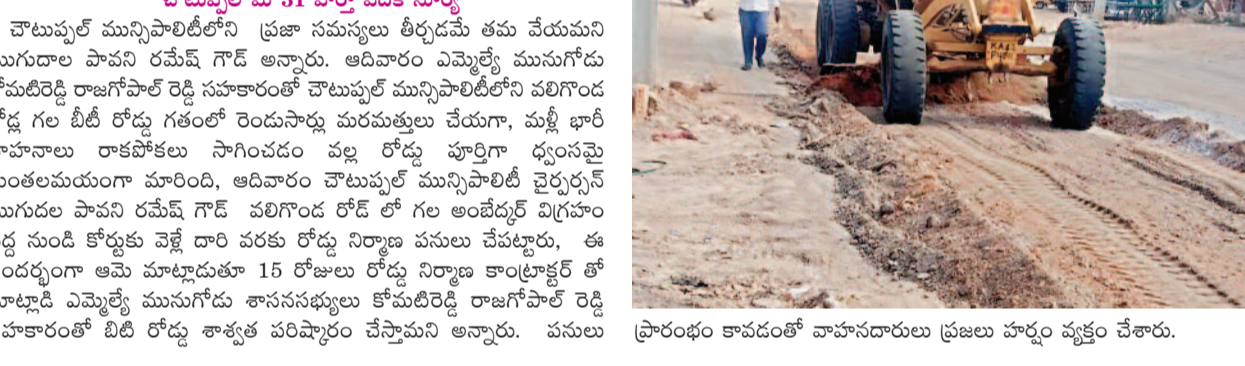
ప్రారంభం కావడంతో వాహనదారులు ప్రజలు హర్షం వ్యక్తం చేశారు.