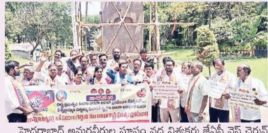
ప్రజా సమస్యలు తీర్చడమే తన లక్ష్యం