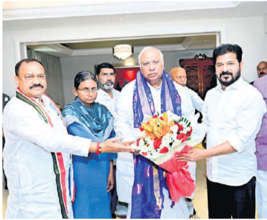
హైదరాబాద్/ఆసిఫాబాద్/శంషాబాద్, (వార్త వేదిక సూర్య)-మే 31:

ముఖ్యమంత్రి రేవంత్ రెడ్డి సోమవారం కుమరంభం ఆసిఫాబాద్ జిల్లాలో పర్యటించనున్నారు. జిల్లాలో పలు అభివృద్ధి పనులకు శంకుస్థాపనలు, ప్రారంభోత్సవాలు చేయనున్నారు. జిల్లాలో సుమారు రూ.112.14 కోట్ల అభివృద్ధి పనులకు శ్రీకారం చుట్టనున్నారు. కెరమరీ మండలం కొరారి పంచాయతీ పరిధిలోని కొత్త గూడలో ఇందిరమ్మ ఇళ్లను ప్రారంభించనున్నారు. కాగజ్ నగర్ ఎక్స్ ప్రెస్ నమీపంలో ఏర్పాటు చేసిన బహిరంగ సభలో పాల్గొంటారు. మిగతా 2లో..