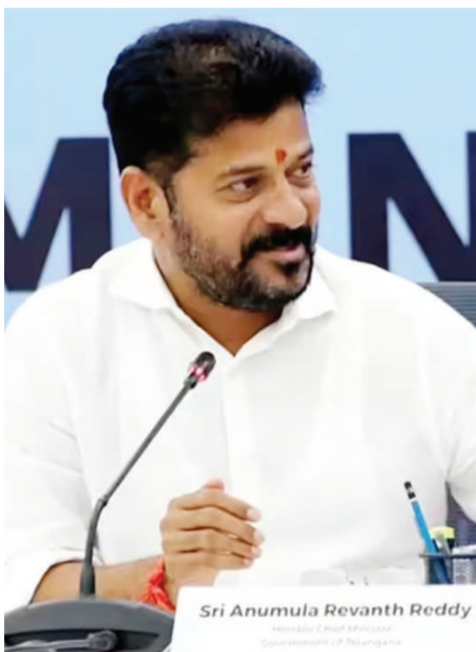
Sri Anumula Revanth Reddy