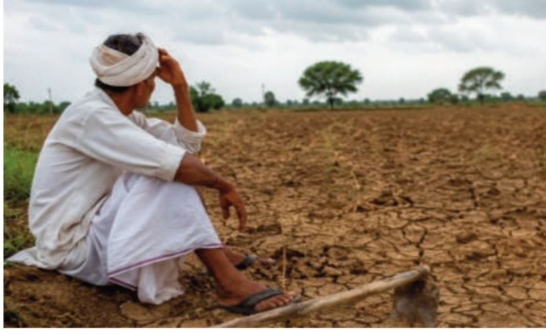
మారాలంటే ప్రకృతి కరుణించాల్సిందేనని వారు పేర్కొంటున్నారు.

మారిపోయాయి. రోహిణి కార్టె నడి నెత్తి పైకి వచ్చిన వచ్చినా వర్షాలు జాడలేదు ఉష్ణోగ్రతలు రోజురోజుకూ పెరిగిపోతూ ఉండడంతో భూములు ఎండిపోతుండగా, భూగర్భ జలాలు కూడా అడుగంటున్నాయి. వర్షాల కోసం ఎదురుచూస్తున్న రైతులు విత్తనాలు కొనాలా వద్దా అనే సందిగ్ధంలో ఉన్నారు. ఇప్పటికే పెట్టుబడుల భారం, ఎరువులు, విత్తనాల ధరల పెరుగుదలతో ఇబ్బందులు ఎదుర్కొంటున్న రైతులకు ప్రకృతి కూడా సహకరించకపోవడం ఆందోళన కలిగిస్తోంది. వాతావరణ మార్పులు, అడవుల నరికివేత, పెరుగుతున్న ఉష్ణోగ్రతలు వంటి కారణాలతో సీజన్ల స్వభావం మారిపోతోందని నిపుణులు చెబుతున్నారు. అకాల వర్షాలు, దీర్ఘకాల ఎండలు వ్యవసాయ రంగంపై తీవ్ర ప్రభావం చూపుతున్నాయని వారు పేర్కొంటున్నారు. రైతు ఆశలు మళ్లీ పచ్చగా