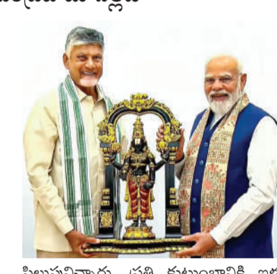
పిలుపునిచ్చారు. ప్రతి కుటుంబానికి ఇళ్లు, తాగునీరు, విద్యుత్, డిజిటల్ కనెక్టివిటీ సహా 7 ప్రాథమిక అవసరాలు కల్పించడమే ఏపీ ప్రభుత్వ లక్ష్యమని ఉద్ఘాటించారు. సమావేశంలో ఉన్నత స్థాయిలో ఉన్న 10 శాతం మంది.. వెనుకబడిన 20 శాతం మందిని ఆదుకునేలా విస్తృత కార్యక్రమం తీసుకువచ్చినట్లు సీఎం చంద్రబాబు ప్రకటించారు. ఏపీలో నివారణ ఆరోగ్య సంరక్షణ, డిజిటల్ హెల్త్ రికార్డుల కోసం 'ప్రాజెక్ట్ సంజీవనీ' అమలు చేస్తున్నట్లు వెల్లడించారు. విద్యార్థులను భవిష్యత్తుకు సిద్ధం చేసేలా ఏజ్ లెర్నింగ్, క్వంటం టెక్నాలజీస్, అడ్వాన్స్డ్ సిగ్నిలింగ్ ప్రోగ్రామ్స్ తీసుకువచ్చినట్లు వివరించారు. మిగతా 2లో..

న్యూఢిల్లీ, జూన్ 11: పాలనలో డిజిటలైజేషన్ కు ప్రాధాన్యం ఇస్తున్నామని అలాగే ఏపీలో కొత్త పాపులేషన్ మేనేజ్మెంట్ పాలసీ తీసుకువస్తామని ఆంధ్రప్రదేశ్ ముఖ్యమంత్రి నారా చంద్రబాబు నాయుడు వ్యాఖ్యానించారు. విద్యార్థుల కోసం ఏజ్ లెర్నింగ్, క్వంటం టెక్నాలజీస్, అడ్వాన్స్డ్ ప్రోగ్రామ్స్ తీసుకు వస్తామని పేర్కొన్నారు. ఢిల్లీలో గురువారం నీతి ఆయోగ్ 11వ గవర్నింగ్ కౌన్సిల్ సమావేశానికి సీఎం చంద్రబాబు హాజరయ్యారు. 'వికసిత భారత్ 2047' లక్ష్యానికి అనుగుణంగా 'స్వర్ణాంధ్ర 2047' ప్రతిష్టాత్మక విజన్ షాన్సును సమర్పించారు. పేదరిక నిర్మూలన, భారీ స్కాయిలో ఉపాధి కల్పన, నైపుణ్యాభివృద్ధి లక్ష్యాలుగా స్వర్ణాంధ్ర రోడ్ మ్యాప్ ప్రకటించారు. గడిచిన రెండేళ్లలో ఏపీ పౌరదర్శక విధానాల వల్ల రూ.23 లక్షల కోట్లకు పైగా పెట్టుబడులని ఆకర్షించామని వెల్లడించారు. ఆర్థి జీవన్, ఆర్థిపీఠియల్ ఇంటిలిజెన్స్, 'అవేర' వంటి ప్రీడిక్టివ్ టూల్స్ తో ఏపీలో సాంకేతిక పాలన కొనసాగిస్తున్నామని సీఎం చంద్రబాబు వివరించారు. పెట్టుబడుల కోసం రాష్ట్రాల మధ్య అనారోగ్యకర పోటీ వద్దని సూచించారు. మౌలిక వసతులు, స్థిరమైన విధానాలపై దృష్టి పెట్టాలని ఆయా రాష్ట్రాలకు చంద్రబాబు