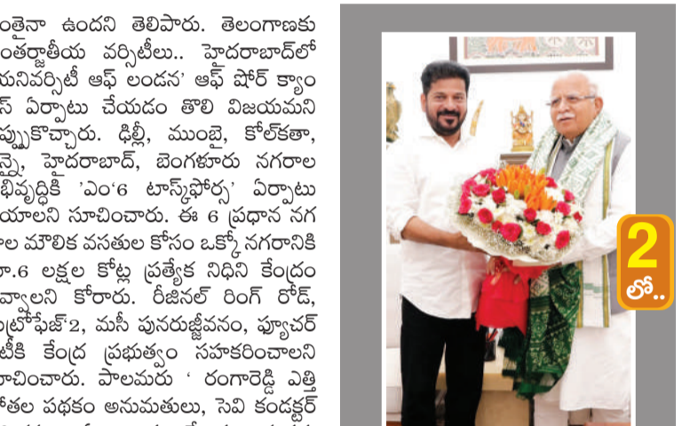
మనోహర్ లాల్ ఖుబ్టర్ తో సిఎం రేవంత్ భేటీ