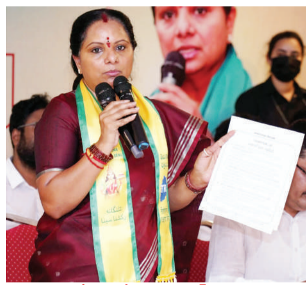
నల్గొండ బ్యూరో, (వార్తా వేదిక సూర్య)-జూన్ 11: నల్గొండ జిల్లా కేంద్రంలో హోటల్ మనోరమ లో తెలంగాణ రక్షణ సేన అధ్యక్షుర్యంలో తెలంగాణ రైతు సంస్థలపై నిర్వహించిన రౌండ్ టేబుల్ సమావేశంలో టీఆర్ఎస్ చీఫ్ కల్వకుంట్ల కవిత పాల్గొన్నారు. ఈ సందర్భంగా కల్వకుంట్ల కవిత మాట్లాడుతూ.. ప్రభుత్వాలకు ఒక విధానం, ఉక్కు సంకల్పం ఉంటే ఎలాంటి సమస్యనైనా తీర్చవచ్చు అని, కానీ రైతుకు ఏదో దయచూపుతున్నాం అని, బిచ్చం వేస్తున్నట్లుగా ప్రభుత్వాల వ్యవహారం ఉందని, రైతుకు ఏదో నాలుగు డబ్బులు ఇచ్చి చేతులు దులుపుకోవటం కాదు. పసి

బిడ్డను కాపాడుకున్నట్లు కాపాడుకోవాలని ఆమె చెప్పారు. మన దేశంలో రైతులు వ్యవసాయం వదిలేస్తున్నారన్న నివేదికలు ఆందోళన కలిగిస్తున్నాయి. వ్యవసాయాన్ని కాపాడుకోవాలంటే దాన్ని ఒక పరిశ్రమగా చూడాలని. ఒక పారిశ్రామికవేత్తకు వాళ్ల పరిశ్రమ పెట్టుకోవటానికి ప్రభుత్వం ఏ విధంగా అన్ని వసతులు కల్పిస్తుందో అదే విధంగా రైతుకు కల్పించాలని కోరారు. మట్టి తల్లి ని అలుసుగా చూస్తూ వ్యవసాయాన్ని ఏదో కర్తవు వదిలేస్తున్నారు. మేము రైతును రాజు చేస్తామని చెబుతున్నాం. అంటే దాని వెంటబడి వ్యవసాయాన్ని బాగు చేసే వరకు వదలం అని అన్నారు. వ్యవసాయాన్ని పరిశ్రమగా చూడాలని నేను ఎంపీగా ఉన్నప్పుడే పార్లమెంట్ లో మాట్లాడారు. ఒక పారిశ్రామిక వేత్తకు ఏ విధమైన గౌరవం దక్కకుండా రైతుకు కూడా అలాంటి గౌరవం వద్దాల్సి అని. రాష్ట్ర వ్యాప్తంగా క్రాఫ్ కాలనీలు ఏర్పాడాలి. పార్టీలతో సంబంధం లేకుండా రైతు సంఘాలు ఏర్పాటు కావాలి అని పేర్కొన్నారు. ముఖ్యంగా రైతు పండించిన పంటకు మార్కెటింగ్ సౌకర్యం కల్పించాలని. నేను నిజామాబాద్ ఎంపీగా ఉన్నప్పుడు జగిత్యాల మామిడి పండ్లకు బ్రాండ్ క్రియేట్ చేశాను. ఢిల్లీలో వాటిని అమ్మేలా ఏర్పాటు చేశాను. ఇప్పటికీ కూడా ఢిల్లీలో జగిత్యాల బ్రాండ్ మామిడి పండ్లను అమ్ముతున్నాను. జగిత్యాల మిగతా 2లో..