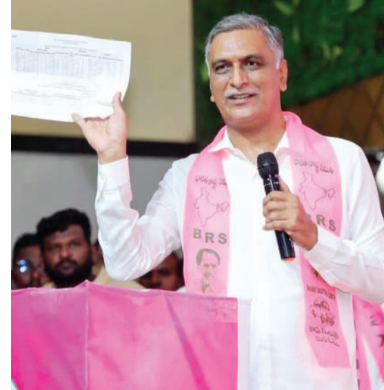
ఎంక్వెరీ చేస్తావా? అంటూ సీఎం రేవంత్ రెడ్డికి మాజీ మంత్రి హరిశ్ రావు ఐపీఎం సవాల్ విసిరారు. ముఖ్యమంత్రి చెప్పిన వ్యక్తికి వర్సింగ్ ప్రెసిడెంట్ పోస్ట్ ఇవ్వలేదని విమర్శించారు. అందుకే ఆ వ్యక్తి మధ్యప్రదేశ్ మంత్రికి సమాచారం ఇచ్చారని తెలిపారు. దీని వెనుక సీఎం రేవంత్ రెడ్డి అనుచరుడు ఉన్నారని చెప్పారు. రూ. 100 కోట్లతో తన నివాసం సవించుకోవడం పెరియల్స్ పేరుతో సీఎం రేవంత్ రెడ్డి నివాసం నిర్మిస్తున్నారని బీఆర్ఎస్ ఎమ్మెల్యే హరిశ్ రావు ఆరోపించారు. ఈ ఇంటి నిర్మాణం మిగతా 2లో..

హైదరాబాద్, (వార్త వేదిక సూర్య)-జూన్ 11: వ్యూచర్ సిటీని వంద శాతం బీఆర్ఎస్ రద్దు చేస్తుందని మాజీ మంత్రి హరిశ్ రావు అన్నారు. సీఎం రేవంత్ రెడ్డి నిర్మాణం వల్ల రూ.70వేల కోట్ల ఫార్మా పెట్టుబడులు పోయామన్నారు. ఫార్మా సిటీ రద్దు చేసి భూములు వెనక్కి ఇస్తామని కాంగ్రెస్ హామీ ఇచ్చింది. భూములు ఫార్మాకు కాకుండా మార్పులు చేస్తే చట్టం అంగీకరించదన్నారు. ఫార్మాసిటీ కోసం తాను కూడా 17 ఎకరాల భూమి ఇచ్చాను. ఆ భూములను రియల్ ఎస్టేట్ వ్యాపారం కోసం వాడితే ఊరుకుంటామని అన్నారు. ఇప్పటికే పలువురు రైతులు ఈ భూములపై కేసులు వేశారు. జర్నలిస్టులపై ప్రేమ ఉంటే వివాదాలు లేని భూములు ఇవ్వచ్చు కదా అన్నారు. వ్యూచర్ సిటీలో జర్నలిస్టులకు ఇళ్ల స్థలాలు ఇచ్చినా మేం వ్యతిరేకించం. పాత భూములనే వారికి ఎందుకు ఇవ్వరని హరిశ్ రావు ప్రశ్నించారు. జర్నలిస్టులకు వెంటనే ప్రత్యామ్నాయ భూములు ఇవ్వాలని అన్నారు. కాంగ్రెస్ పార్టీ తెలంగాణ రాష్ట్ర వ్యవహారాల ఇన్ ఛార్జి వినాక్షి నటరాజన్ రాజ్యసభ అభ్యర్థిగా దాఖలు చేసిన పిటిషన్ తిరస్కరించడం వెనుక రాష్ట్రంలోని ఆ పార్టీ నేత హస్తం ఉందని హరిశ్ రావు ఆరోపించారు. ఆమెకు తెలంగాణ కాంగ్రెస్ పార్టీ వెన్నుపోటు పొడిచిందన్నారు. వినాక్షి నటరాజన్ పై కేసు ఉన్నట్లు తెలంగాణ నుంచే తమకు సమచారం అందిందని మధ్యప్రదేశ్ బీజేపీ మంత్రి చెప్పారని హరిశ్ రావు స్పష్టం చేశారు. ఈ కేసును బీజేపీ మంత్రికి లీక్ చేసింది ఎవరని.. కాంగ్రెస్ పార్టీ అగ్రనేతలను ఆయన సూటిగా ప్రశ్నించారు. వినాక్షి నటరాజన్ కేసును లీక్ చేసింది ఎవరనే దానిపై ప్రత్యేక దర్యాప్తు సంస్థ (సీబీ), జ్యుడిషియరీ