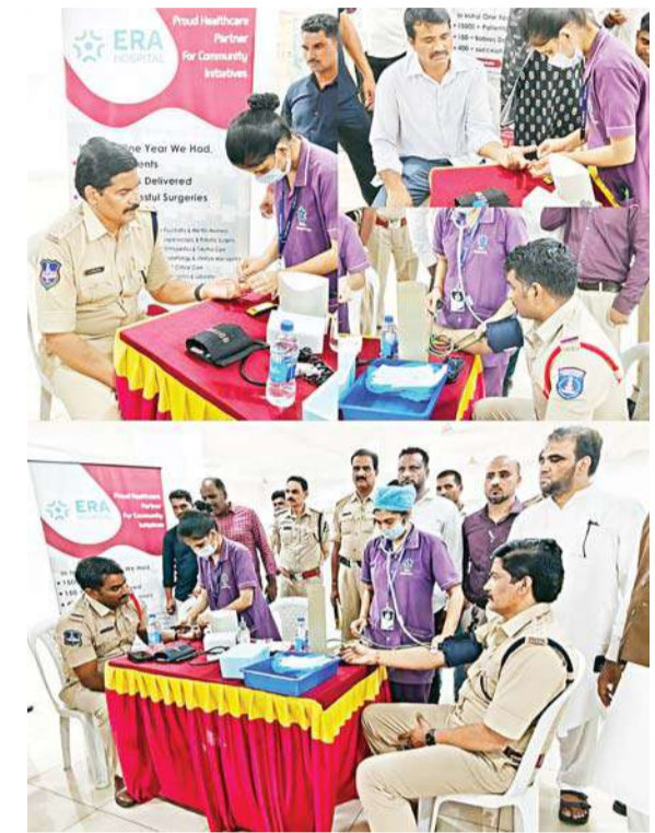
జీవితానికి-వ్యక్తిగత జీవితానికి మధ్య సమ తుల్యతను ఎలా సాధించాలో వివరించారు. ఈ శిబిరంలో మైలార్దేవ్పల్లి పోలీస్ స్టేషన్ సిబ్బందితో పాటు రాజేంద్రనగర్ జోనల్ ఫోర్స్ సిబ్బంది పెద్ద సంఖ్యలో పాల్గొని పరీక్షలు చేయించుకున్నారు. ఈ సందర్భంగా సిబ్బందికి పలు ఉచిత పరీక్షలు నిర్వహించి, వైద్యుల సలహాల మేరకు మందులను పంపిణీ చేశారు.