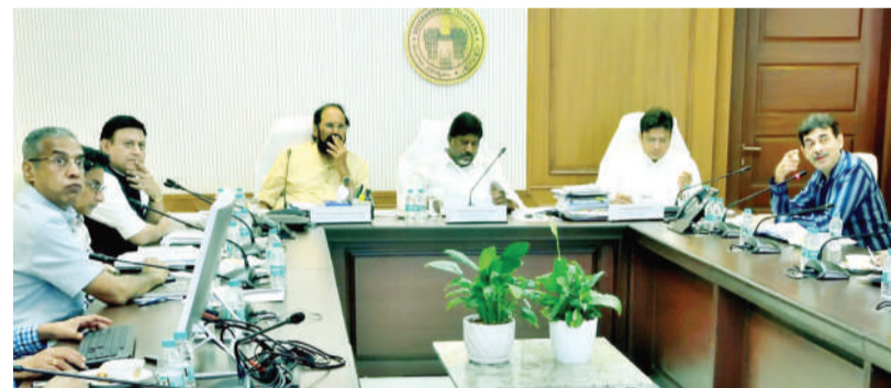
హైదరాబాద్, జూన్ 12 (వాక్ వేదిక సూర్య):

గోదావరి నదిపై నిర్మించబడే సమ్మక్క, సారక్క బ్యారేజ్/ సమ్మక్క సాగర్ ప్రాజెక్టు అనుమతుల సాధనలో తెలంగాణ ప్రభుత్వం మరో కీలక ముందడుగు వదిలినది రాష్ట్ర నీటిపారుదల, పౌర సరఫరాల శాఖ మంత్రి ఉత్తమ్ కుమార్ రెడ్డి వెల్లడించారు. గురువారం రాత్రి హైదరాబాద్ కు వచ్చిన ఛత్తీస్ గఢ్ ముఖ్యమంత్రి విష్ణు దేవ్ నాయి తో హైదరాబాద్ లోని పార్ట్ హౌయిట్లో రాష్ట్ర నీటిపారుదల, పౌర సరఫరాల శాఖ మంత్రి ఉత్తమ్ కుమార్ రెడ్డి పునాది స్థాపన సాగింది. అనంతరం రాష్ట్ర నీటి పారుదల శాఖ ఇంజనీరింగ్ అధికారుల బృందంతో కలిసి ఛత్తీస్ గఢ్ ముఖ్యమంత్రితో మంత్రి ఉత్తమ్ కుమార్ రెడ్డి ప్రత్యేకంగా సమావేశమయ్యారు. ఈ సమావేశంలో ఛత్తీస్ గఢ్ తెలంగాణ రాష్ట్రాల సరిహద్దు ప్రాంతంలో నిర్మించబడే సమ్మక్క, సారక్క ప్రాజెక్టుపై సుదీర్ఘంగా చర్చించారు. ప్రాజెక్టు డిజైన్ లను కేంద్ర జల సంఘం తుది పరిశీలనకు తీసుకెళ్లేందుకు అవసరమైన అభ్యంతర రహిత పత్రం, ఎన్ టీ సీ జారీ చేయాలని తెలంగాణ ప్రభుత్వం తరఫున మంత్రి ఉత్తమ్ కుమార్ రెడ్డి అధికారిక విజ్ఞాపన పత్రాన్ని ఛత్తీస్ గఢ్ ముఖ్యమంత్రికి సమర్పించారు. తెలంగాణ రాష్ట్రంలో కాంగ్రెస్ ప్రభుత్వం అధికారంలోకి వచ్చిన తర్వాత గోదావరి జలాల వినియోగం, పెండింగ్ నీటిపారుదల ప్రాజెక్టుల పూర్తి, రైతాంగానికి శాశ్వత సాగునీటి భద్రత కల్పించడం వంటి అంశాలకు అత్యున్నత మిగతా 2లో..