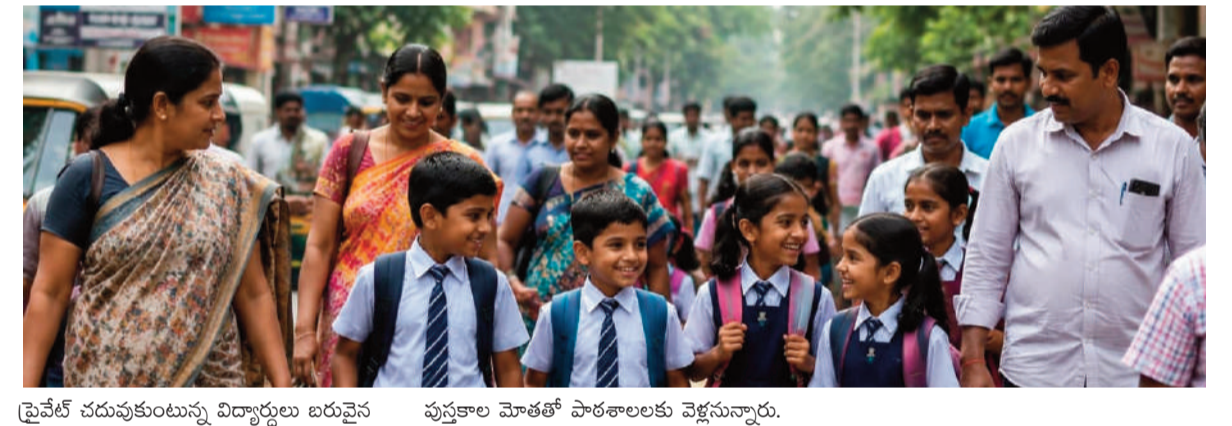
ప్రైవేట్ చదువుకుంటున్న విద్యార్థులు బయట ప్రవేశాల మోతతో పాఠశాలలకు వెళ్తున్నారు.

మోతూరు, జూన్ 14 (వార్త వేదిక సూర్య): వేసవి సెలవులు ముగిసి... బడికి వేళాయే సమయం ఆసన్నమైంది. ఏటా జూన్ 12 నుంచి పాఠశాలలు ప్రారంభమై ఏప్రిల్ 23 వరకు కొనసాగిస్తాయి. ఏప్రిల్ 24 నుండి 11 వరకు (49 రోజుల పాటు) విద్య సంస్థలకు రాష్ట్ర ప్రభుత్వం సెలవులు ప్రకటిస్తుంది... ఈ విద్యా సంవత్సరం జూన్ 12న ప్రారంభం కావాలి ఉండగా ఒక ప్రక్క ఎండలు తగ్గకపోవడంతో పాటు 12 తేదీ శుక్రవారం కావడం ఆ తరువరి (రెండో శనివారం) ఉండటంతో జూన్ 14 వరకు ప్రభుత్వం సెలవులను పొడిగించింది. సోమవారం నుంచి పాఠశాల ప్రారంభం కావడంతో ప్రభుత్వ