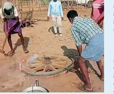
అటకెక్కిన సాంప్రదాయ సాగ

తయారు చేయడం, ఎడ్లబండ్లకు చెక్కలు బిగించడం వంటి పనులు చేసేవాడు. ఆ కొలిమి కేవలం పని జరిగే స్థలం కాదు; అదొక గ్రామీణ పౌడ్రమెంట్. కొలిమి చుట్టూ రైతులు గుమిగూడి చర్చలు, పంటలు, మార్కెట్ ధరలు, రాజకీయాలు, గ్రామ విషయాలపై గంటలు తలబడి ముచ్చటించుకునేవారు. ఆ ప్రదేశం గ్రామీణ సమాజానికి ఒక సమాచార కేంద్రంలా ఉండేది. ఇప్పుడు ఆ కొలిమి మంటలు ఆరిపోయాయి. రైతులతో కిటికీలాపాడి ఆ వాకిట్ల వెలవెలపోతున్నాయి.