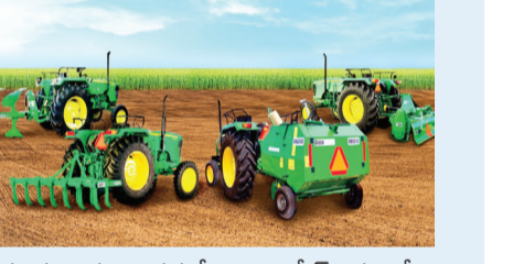
ఇప్పుడు ప్రతి దశలో కొలిమి కంపెనీల యంత్రాలపై, అద్దెపై ఆధారపడాలి వస్తోంది.

ఒకప్పుడు ఎద్దులతో దున్నడం చేస్తే సొంత మేత, సంరక్షణ ఖర్చులతోనే పని జరిగిపోయేది. ఇప్పుడు ప్రతి చిన్న పనికి ట్రాక్టర్ అద్దె, డీజిల్ ధరలు, యంత్రాల నిర్వహణ ఖర్చులు భారించాలి. గతంలో రైతు స్వయంసమృద్ధితో ఉండేవాడు;