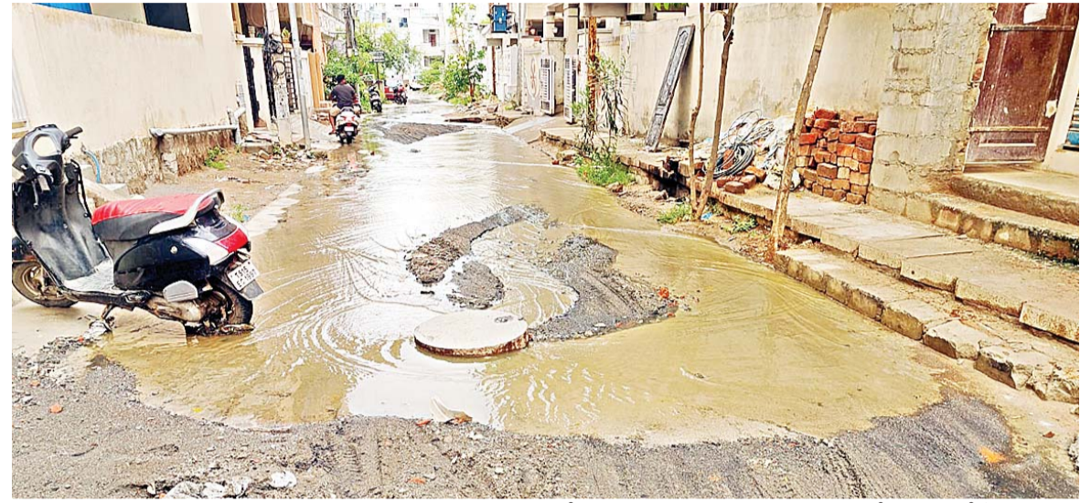
చిన్న వర్షానికి వరదలా మురుగు నీరు

లేకుండా పోతుందని ఆగ్రహం వ్యక్తం చేశారు. డ్రైనేజీ పైవే లైన్లు పైపులు చిన్నగా ఉండడంతో ఈ సమస్య వస్తుందని డ్రైనేజీ పైవే లైన్లు పైపులు పెద్దవి వేసి డ్రైనేజీ సమస్యను పరిష్కరిస్తామని అధికారులు చెబుతున్నప్పటికీ ఫలితం శూన్యమని స్థానికులు వాపోతున్నారు. వర్షం పడిందంటే... నాలుగు ఐదు రోజులు ఆ రోడ్డు అంతా మురికి కూపంగా మారుతుందని స్థానికులు ఆవేదన వ్యక్తం చేస్తున్నారు. గత ఐదు, ఆరు సంవత్సరాల క్రితం అప్పటి జనాభాకు అనుగుణంగా డ్రైనేజీ పైవే లైన్ లో పైపులు చిన్నవి ఏర్పాటు చేయడం, అనంతరం కాలనీ విస్తరించి ఎన్నో కాలనీలలో నిర్మాణాలు రావడంతో నివాసాలు ఏర్పరుచుకున్న జనాభాకు అనుగుణంగా డ్రైనేజీ వ్యవస్థ లేకపోవడంతో ఈ సమస్య జటిలింగా మారినది స్థానికులు వాపోతున్నారు. ప్రస్తుత జనాభాకు అనుగుణంగా డ్రైనేజీ పైపులైన్లు పైపులు పెద్దవి ఏర్పాటు చేసి ఈ సమస్యకు శాశ్వత పరిష్కారం కల్పించాలని కాలనీవాసులు డిమాండ్ చేస్తున్నారు. లేనిపక్షంలో కాలనీవాసులందరితో కలిసి పెద్ద ఎత్తున అందోళన చేపడతామని కాలనీ వాసులు అధికారులను హెచ్చరిస్తున్నారు.