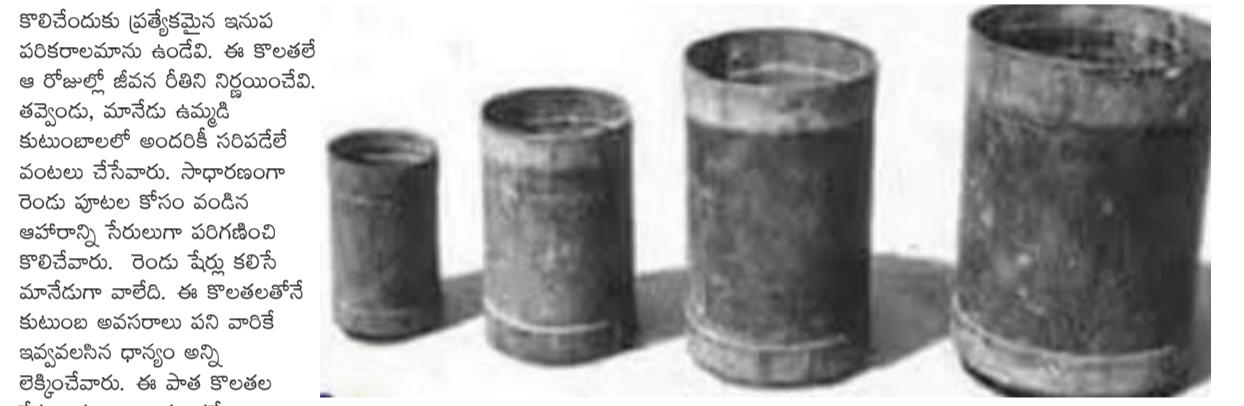
అవసరం ఉంది. పాత జ్ఞాపకాలను గుర్తు చేసుకుంటూ ఈ విలువలను కొత్త తరానికి అందించడం ప్రతి ఒక్కరి బాధ్యతగా తీసుకోవాలి.

మోతూరు, జూన్ 14 ( వార్త వేదిక సూర్య): డిజిటల్ యుగంలోకి తీసుకువచ్చే ఈ కాలంలో ఒకప్పుటి గ్రామీణ జీవన విధానం ప్రధానంగా కొలతల సంస్కృతి నెమ్మదిగా జ్ఞాపకాల గర్భంలో కలిసిపోతున్నాయి. అప్పట్లో వాడిన కొలతల పాత్రలు వంటి పేర్లు వాటి వెనుకాల ఉన్న జీవన విధానం, ఇవన్నీ నేటి తరానికి కొత్తగానే అనిపిస్తున్నాయి. ఒకప్పుడు ఉమ్మడి కుటుంబాల ఆనందం, ఆప్యాయతలే ఆస్తిగా భావించిన రోజులు, చెమట చిందించి, సంపాదించిన ధాన్యమే సంపద పై కంటే పరస్పర బంధాలు, మనుషులు పెద్దవిగా నిలిచిన కాలం అది వ్యవసాయం ప్రధాన ఆదాయం కావడంతో పని చేసిన ప్రతిఫలం కూడా ధ్యానంగానే అందుకనే సాంప్రదాయం ఉండేది. పద్దు, జొన్నలు, సజ్జలు, కంకులు, బొప్పిర్లు వంటి ధాన్యాలను కొలిచేందుకు ప్రత్యేకమైన ఇసుప పరికరాలమాను ఉండేవి. ఈ కొలతలే ఆ రోజుల్లో జీవన రీతిని నిర్ణయించేవి. తవ్వెందు, మానేడు ఉమ్మడి కుటుంబాలలో అందరికీ సరిపడేట వంటలు చేసేవారు. సాధారణంగా రెండు పూటల కోసం వండిన ఆహారాన్ని సేరులుగా పరిగణించి కొలిచేవారు. రెండు పేర్లు కలిసి మానేడుగా వాటిది. ఈ కొలతలతోనే కుటుంబ ఆవసరాలు పని వారికే ఇవ్వవలసిన ధాన్యం అన్ని రెక్కీంచేవారు. ఈ పాత కొలతల కేసుల పదాలుగా మాత్రమే మిగిలిపోకుండా వాటి వెనుక ఉన్న సంస్కృతి, ఇసుప బంధాలను కూడా తెలుసుకోవాల్సిన అవసరం ఉంది. పాత జ్ఞాపకాలను గుర్తు చేసుకుంటూ ఈ విలువలను కొత్త తరానికి అందించడం ప్రతి ఒక్కరి బాధ్యతగా తీసుకోవాలి.