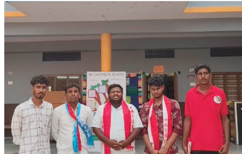
న్నారు. పాఠశాలకు ఆట స్థలం లేకుండా, ఇరుకు లాగా ఉండుతున్నారని వారు ఆవేదన వ్యక్తం గదులలో నిర్వహిస్తూ విద్యార్థులను బండ్లు చేశారు. పాఠశాలకు పక్కనే భీమలింగం కట్ట