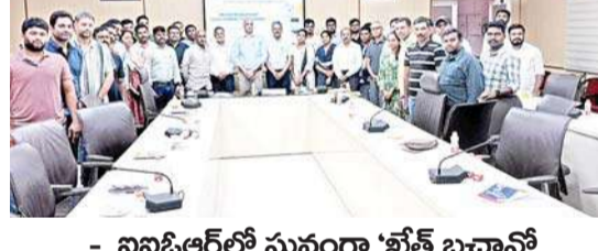
- ఐబిఆర్లో ఘనంగా 'భోజ్ బచావో' అభియాన్ - రసాయన ఎరువుల వాడకం తగ్గించాలని శాస్త్రవేత్తల పిలుపు

రాజేంద్రనగర్, జూన్ 19 (వార్త వేదిక సూర్య) : అధ్యక్షులుగా రసాయన ఎరువుల వాడకం భూమి నిస్సారంగా మారి, భవిష్యత్ తరాలకు సాగు భూమి లేకుండా పోతుందని శాస్త్రవేత్తలు ఆందోళన వ్యక్తం చేశారు. భారత ప్రభుత్వ అధ్యక్షులలో నిర్వహిస్తున్న 'భోజ్ బచావో అభియాన్' కార్యక్రమంలో భాగంగా శుక్రవారం హైదరాబాద్లోని