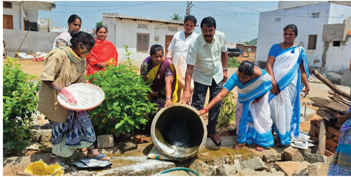
త్వరిత వర్షాల ప్రారంభం కానున్న సేవల్లో గ్రామంలో అవసరమైన మందులు మరియు వైద్య సామగ్రి అందుబాటులో ఉండేలా చూడాలని, ప్రజల్లో ఆరోగ్య అవగాహన కార్యక్రమాలను నిర్వహించాలని సంబంధిత అధికారులను ఆదేశించారు. గ్రామంలో ఎక్కడా డెంగ్యూ మరియు ఇతర ఆరోగ్య సమస్యలు లేవు అని నిర్ధారించారు. ప్రజల ఆరోగ్య పరిరక్షణకు పారిశుధ్య కార్యక్రమాలను నిరంతరం కొనసాగించాలని ఆయన సూచించారు.

వలిగొండ: జూన్ 19 (వార్త వేదిక సూర్య) యాదాద్రి భువనగిరి జిల్లా వలిగొండ మండల పరిధిలోని నాగారం గ్రామంలో వలిగొండ ఎంపీడిఐ జలంధర్ రెడ్డి, గ్రామ పంచాయతీ కార్యదర్శి, సర్పంచ్ తో కలిసి గ్రామంలో నిర్మాణం ఉన్న ఇందిరమ్మ ఇండ్ల పురోగతిని పరిశీలించి ఆయన, లబ్ధిదారులు మరియు మేల్కొలిపిన నిర్మాణ పనులను అత్యంత ప్రాధాన్యతతో త్వరితగతిన పూర్తి చేయాలని సూచించారు. అలాగే సంబంధిత అధికారులు ఇందిరమ్మ ఇండ్ల నిర్మాణ పురోగతిని నిరంతరం పర్యవేక్షిస్తూ, ప్రతి వారం స్థితిగతులను సమీక్షించి నివేదించాలని దేశించారు. ఆనంతరం శుక్రవారం నిర్వహించిన "ప్రైవేట్ డే" కార్యక్రమంలో భాగంగా నాగారం గ్రామ పంచాయతీ కార్యదర్శితో కలిసి గ్రామంలోని పారిశుధ్యం మరియు పరిశుభ్రత పరిస్థితులను పరిశీలించారు. గ్రామంలో నిల్వ ఉన్న మురుగు నీటి ప్రాంతాలు మరియు డోమల వ్యాప్తికి అవకాశం ఉన్న ప్రదేశాల్లో ఆయన్ ట్యాంక్, డ్రిప్ లైన్ పోడంట్లను పర్యవేక్షించి నిర్ధారించారు. డోమల పెరుగుదలను నివారించి, వ్యాధుల వ్యాప్తిని అరికట్టేందుకు అవసరమైన అన్ని చర్యలు తీసుకోవాలని అధికారులకు సూచించారు.