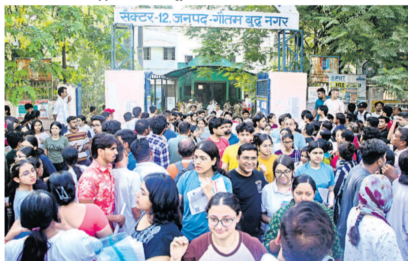
న్యూఢిల్లీ/హైదరాబాద్, జూన్ 21 (వార్త వేదిక సూర్య):

• బెంబేలెత్తించిన ఫిజిక్స్, కెమిస్ట్రీ ప్రశ్నలు • కాస్త సులువుగా వ్యక్త, జంతుశాస్త్రాలు • ఈసారి కటాఫ్ తగ్గిపోవచ్చన్న నిపుణులు • 430-450 స్కోర్ చేస్తే తెలంగాణలో కన్వీనర్ కోటా సీటు రావొచ్చని అంచనా • దేశవ్యాప్తంగా హాజరైన 20 లక్షల మంది • తెలంగాణలో 89.09 శాతం హాజరు • నిమిషం ఆలస్యమైనా అనుమతించని అధికారులు.. విద్యార్థుల కన్నీళ్లు • కాన్వాయిట్ అభ్యర్థులకు ఇబ్బందికావొద్దని 45నిమిషాలు ఢిల్లీ ఎయిర్పోర్టులోనే మోదీ