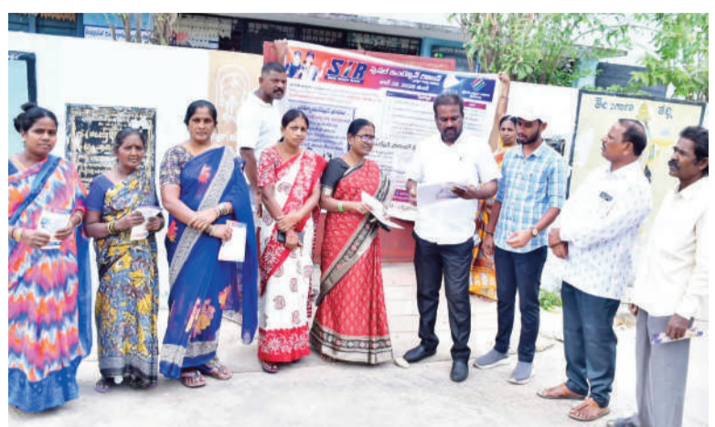
సంఘం 2002 నాటి ఓటర్ల జాబితాను ప్రామాణికంగా తీసుకుని ఓటర్లను గుర్తించే విధానంపై తీవ్ర అభ్యంతరం వ్యక్తం చేశారు. ఈ ప్రక్రియ వల్ల ప్రజలు అయోమయానికి గురయ్యే అవకాశం ఉందని ఆందోళన వ్యక్తం చేశారు. డాక్టర్ బాబాసాహెబ్ అంబేద్కర్ చేశ ప్రజలకు కల్పించిన ఓటు హక్కును పరిరక్షించాలని బాధ్యత అందరిపై ఉందని పేర్కొన్నారు. కేవలం డబుల్ ఓట్లు, మరణించిన వారి పేర్లను తొలగించేందుకు ఇంత పెద్ద