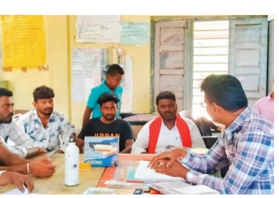
ఇంత తక్కువ ధరలో విద్యార్థులకు నాణ్యమైన, పోష్టికాహారాన్ని అందించడం సాధ్యం కాదని ఆవేదన వ్యక్తం చేశారు. స్కూల్లోని 6 గదుల్లో మొత్తం 12 ఫ్యాన్లు ఉండగా, వాటిలో 8 మాత్రమే పని చేస్తున్నాయి, 4 ఫ్యాన్లు పాడైపోయాయి. వాటి స్థానంలో కొత్త ఫ్యాన్లు అమర్చాలని కోరారు. పాఠశాలలోని మంచినీటి ట్యాంకును శుభ్రం చేయడానికి నెలల తరబడి వేచి చూడాలి వస్తోందని 31 మంది విద్యార్థులను ఉండగా కేవలం ఒక ఒక్క బాట్రూమ్ పోల్గొన్నారు.