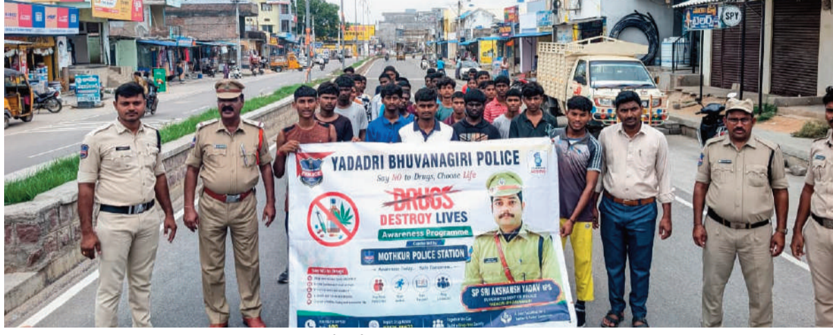
సారించాలని సూచించారు. మదక ప్రవాలకు వల్ల కలిగే శారీరక, మానసిక, సామాజిక, ఆర్థిక దుష్ఫలితాలపై అవగాహన కల్పించారు.