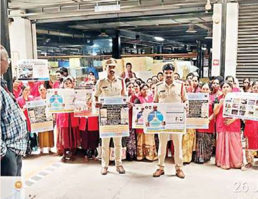
డ్రగ్స్ రహిత సమాజానికి ప్రతి ఒక్కరూ సహకరించాలి