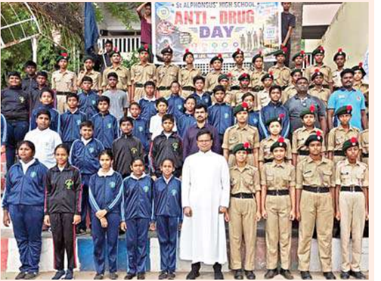
నల్లగొండ లో ఘనంగా అంతర్జాతీయ మాదక ద్రవ్యాల వ్యతిరేక దినోత్సవం