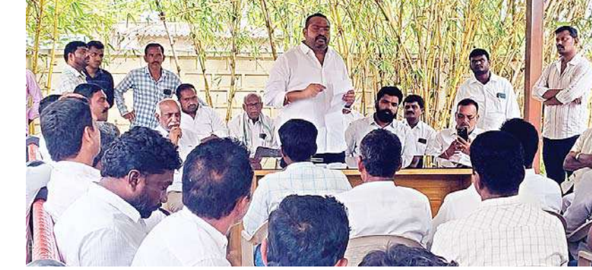
కాంగ్రెస్ పార్టీ తిప్పిల్ల మండల నాయకులు