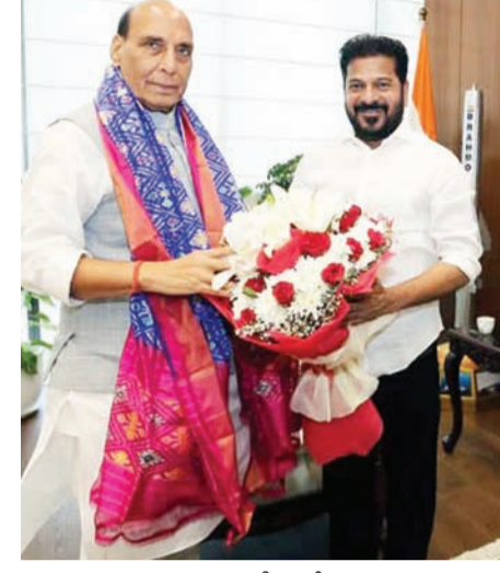
శాలపై చర్చించారు. గాంధీ సరోవర్ ప్రాజెక్టుకు రక్షణ శాఖ భూములు బదలాయిచినందుకు రాజీనాథ్ సింగ్ కు.. సీఎం కృతజ్ఞతలు తెలిపారు. దేశ సమగ్రత, రక్షణకు సంబంధించిన అంశం కావడంతో రాష్ట్ర ప్రభుత్వం తరపున అన్నివిధాలా సహాయ, సహకారాలు అందిస్తామని కేంద్రమంత్రికి స్పష్టం చేశారు సీఎం. ఆదిలాబాద్ రాంపన్న భారతీయ వాయుసేన ఎయిర్పోర్టును భారీగా విస్తరిస్తున్నామని తెలిపారు.

ఆదిలాబాద్ ఎయిర్పోర్టు నిర్మాణానికి రాష్ట్రం అన్ని విధాలా సహకారం అందిస్తుందని సీఎం రేవంత్ రెడ్డి స్పష్టం చేశారు. రాష్ట్ర ప్రభుత్వం అత్యంత ప్రాధాన్యమిస్తానని ప్రాజెక్టులో ఒకటిన ఆదిలాబాద్ ఎయిర్పోర్ట్ అభివృద్ధికి సంబంధించి తమ ప్రభుత్వం భూ సేకరణ, యుటిలిటీస్ బదలాయింపు వంటి అంశాల్లో పూర్తి సహకారం అందిస్తామని కేంద్ర మంత్రి రేవంత్ రెడ్డి తెలిపారు. కేంద్ర రక్షణ శాఖ మంత్రి రాజీనాథ్ సింగ్ తో తెలంగాణ ముఖ్యమంత్రి రేవంత్ రెడ్డి ఢిల్లీలో సోమవారం సమావేశం అయ్యారు. ఈ ఢిల్లీలో ఇరువురు నేతలు పలు కీలక అంశాలపై చర్చించారు. గాంధీ సరోవర్ ప్రాజెక్టుకు రక్షణ శాఖ భూములు బదలాయిచినందుకు రాజీనాథ్ సింగ్ కు.. సీఎం కృతజ్ఞతలు తెలిపారు. దేశ సమగ్రత, రక్షణకు సంబంధించిన అంశం కావడంతో రాష్ట్ర ప్రభుత్వం తరపున అన్నివిధాలా సహాయ, సహకారాలు అందిస్తామని కేంద్రమంత్రికి స్పష్టం చేశారు సీఎం. ఆదిలాబాద్ రాంపన్న భారతీయ వాయుసేన ఎయిర్పోర్టును భారీగా విస్తరిస్తున్నామని తెలిపారు.