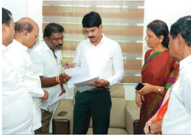
గ్రామంలోని అభివృద్ధి పనులకు నిధుల మంజూరు చేసే విధంగా ప్రభుత్వం పై వత్తిడి తెచ్చి గ్రామానికి మరింత అభివృద్ధి పనులు చేపడతామని తెలిపారు.

కోసం ఆర్. ఓ. ప్లాంట్ ఏర్పాటు చేయటం, అదేవిధముగా గ్రామంలోని మెట్ల బావి, గడికోట ప్రాంగణమును సి ఎస్ ఆర్ నిధులతోటి అభివృద్ధి పరిచి పర్యాటక కేంద్రముగా మార్చుటకు స్థానిక శాసన సభ్యురాలు మాజీ విద్యా శాఖ మంత్రి సబితా ఇంద్రారెడ్డి సహకారంతో జిల్లా కలెక్టర్ రంగారెడ్డి కి వినతి పత్రం సమర్పించడం జరిగింది. సమస్యలపై కలెక్టర్ రంగారెడ్డి జిల్లా సానుకూలంగా స్పందిస్తూ ఆంశాలకు సంబంధించి నిధుల మంజూరుకు ఆమోదం తెలిపారు. అనంతరం సబితా ఇంద్రారెడ్డి మాట్లాడుతూ గ్రామ పంచాయతీ మహేశ్వరం పరిధిలో నిరుపేదలైన, అర్హులైన స్థానిక ప్రజలకు డబుల్ బెడ్ రూమ్ ఇండ్ల కేటాయింపడం జరుగుతుందని అభేదభయంగా